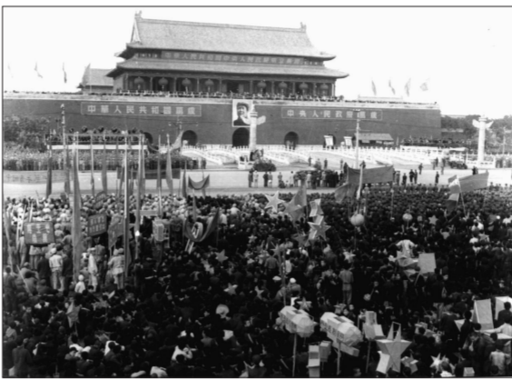
一九四九年十月一日天安门开国大典主会场。孟昭出摄