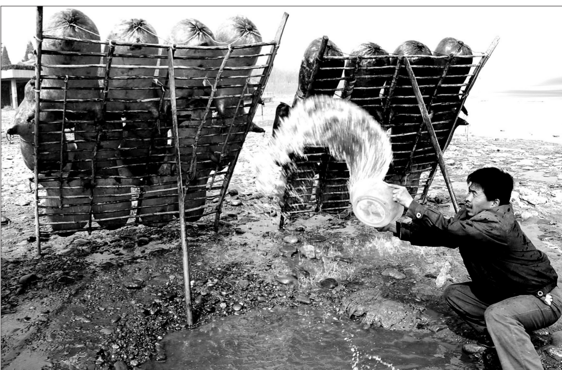
黄河上的羊皮筏子(组照之一) 任世琛(中国非遗摄影大展金奖作品)