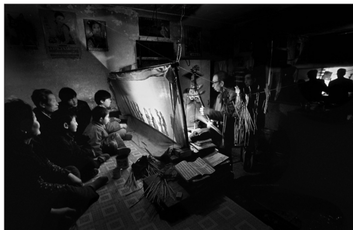
乡村皮影戏(组照之一) 冷柏(中国非遗摄影大展金奖作品)

“我们的精神家园——2011中国非物质文化遗产摄影大展”展览将于2011年6月10日,在中华世纪坛当代艺术中心举办。展览荟萃了一批真实、典型、艺术地反映中国非物质文化遗产本真状态和丰富面貌,融纪实性和艺术性、真实性和典型性于一体的精彩摄影之作。无论摄影师还是普通民众,无论参与拍摄还是驻足观赏,都能增进大家对非物质文化遗产价值和存续状态的认识,增进大家的保护意识和文化自觉!