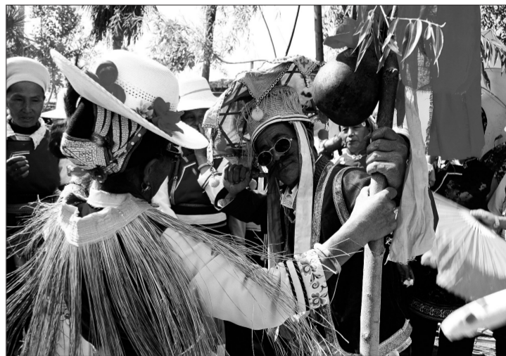
白族绕三灵(组照之一) 余国勇(中国非遗摄影大展银奖作品)