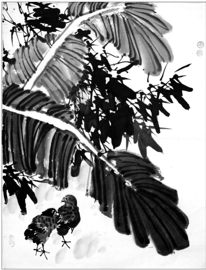
竹鸡细雨图(国画) 黄叶村

本次展览共展出优秀美术作品116幅、摄影作品55幅。通过艺术家精心捕捉与制作的作品,呈现了长白山伟岸的雄姿、神秘的天池风光、茫茫的林海雪原、红红火火的关东生活等极具地域特色的自然与人文景观。展出作品不仅代表了吉林省美术、摄影的整体水平和创作实力,也抒发了吉林文艺工作者对生活的热爱与赞美。