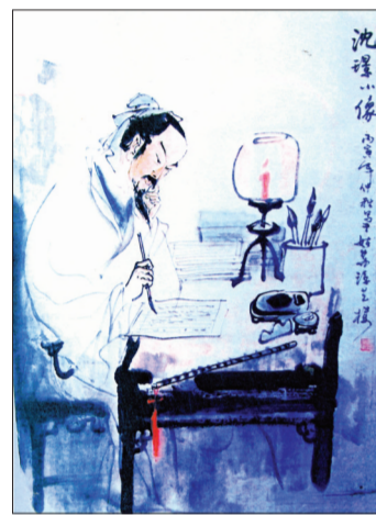
昆曲吴江派领袖沈璟

今天的吴江,在继承传统的基础上,不断创新,戏曲团队遍布城乡。各个乡镇都建立各具特色的戏曲团队,其中盛泽、松陵、震泽等镇更是“一镇多团”,交流比赛,砥砺相长,一派戏曲艺术之乡氛围。目前全市已建立戏曲团队44个,参与活动的主要骨干1200余人,他们既自我娱乐,又经常为当地群众演出,极大地丰富了群众的文化生活,一些著名团队的足迹踏遍全市甚至江浙沪毗邻地区。