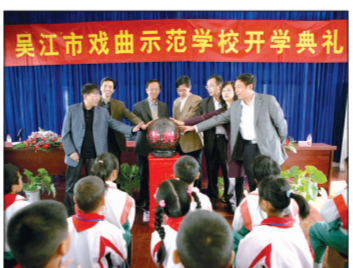
吴江戏曲示范学校开学典礼

苑利(中国艺术研究院研究员):吴江搞“戏曲文化生态保护区”很好,因为进行整体的区域性保护要比从个体保护更科学一些。保护区的规划可能还要进行更深入的探索,“戏曲文化生态保护区”要有传承主体,传承人到底是怎么定?传承人培养的后备人才,是通过什么渠道,通过哪几种方式进行培养?一个县级市有二十几个部门,需要整合各个部门的力量来完