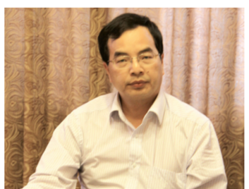
吴江市文广局局长金健康在座谈会上介绍有关情况