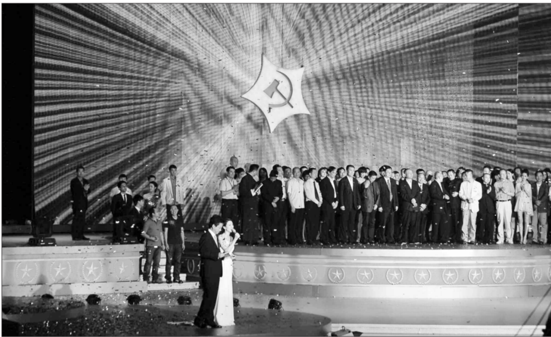
《建党伟业》北京首映典礼现场，主创人员聚集在升起的党徽之下。

第四届北京市大学生声音作品大赛从开赛以来，历时2月余，征集到了来自京城内外近50所高校的广播节目和声音作品。在颁奖典礼中，主办方以颁发优秀组织奖的形式向中国人民大学、北京石油化学学院、北京农学院、南方医科大学为代表的协办院校表达了感谢。