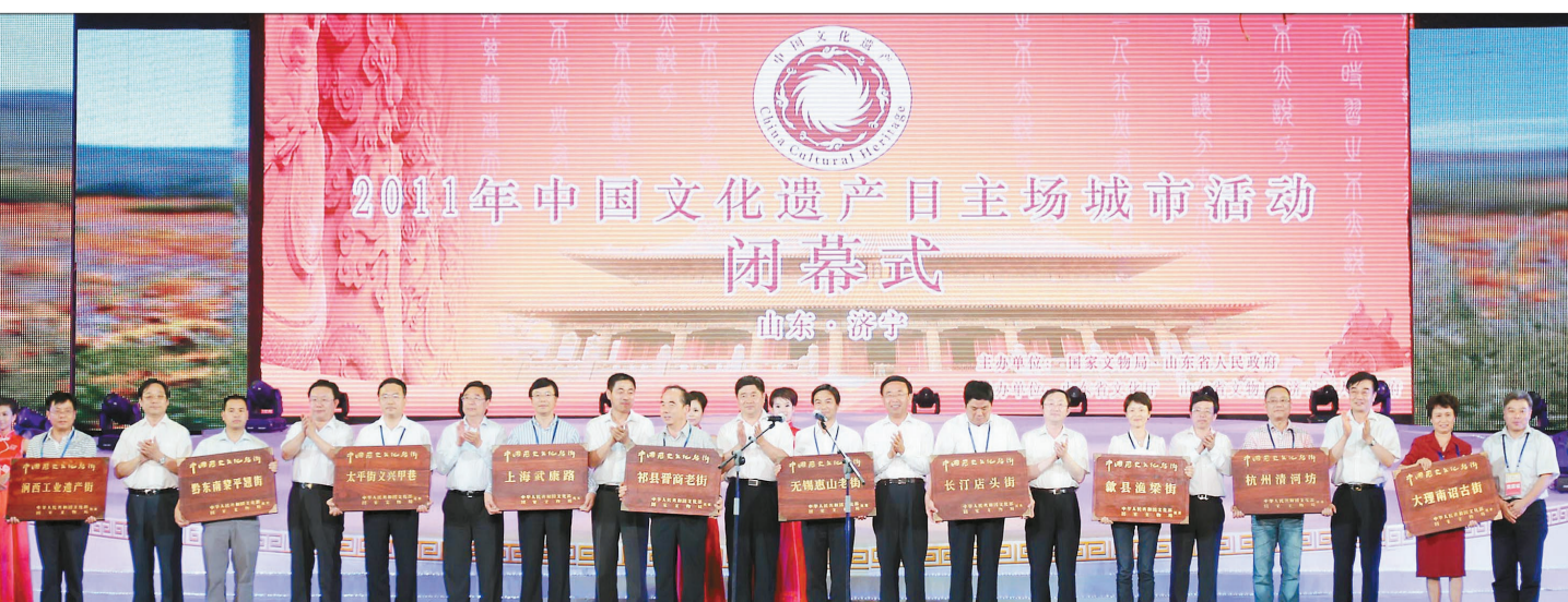
2011年中国文化遗产日主场城市活动闭幕式