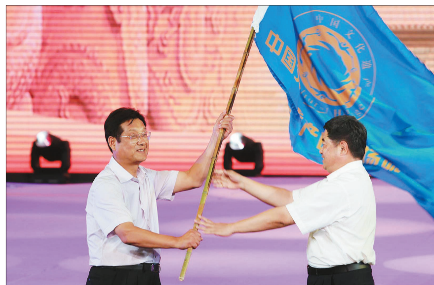
河南省郑州市市委常委、宣传部部长丁世显从国家文物局局长单霁翔手中接过了2012年中国文化遗产日主场活动城市会旗