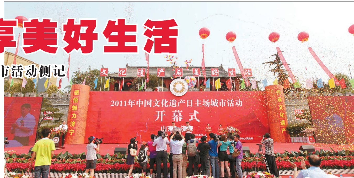
2011年中国文化遗产日主场城市活动开幕式在山东省济宁市太白广场举行