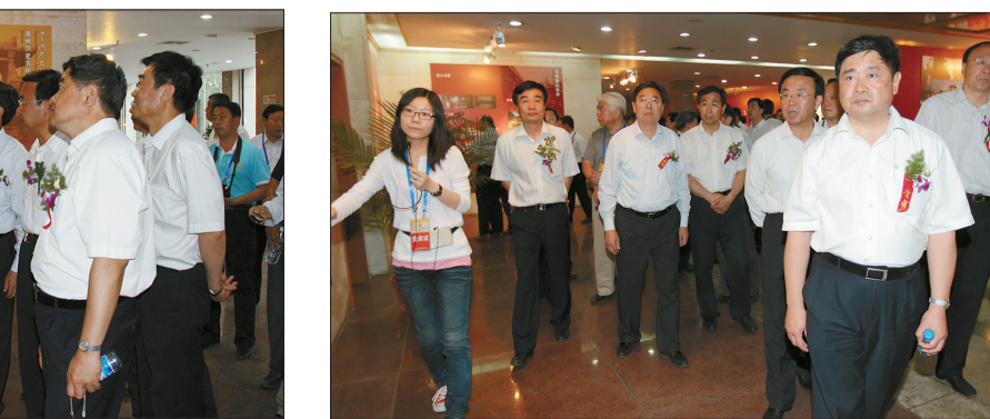
“中国历史文化名街”成果展现场