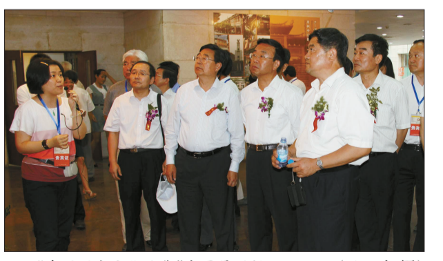
“中国历史文化名街”成果展现场

6月9日下午两点的“三孔”圣地,风和日丽,书声朗朗。中国文物信息咨询中心主任吴东福和中国教育学会会长顾明远共同播响了第三届全国青少年文化遗产知识大赛的鼓点。来自北京师范大学附属实验中学、中国人民大学附属中学、北京市第四中学、南京外国语学校等全国16所知名高中的80名参赛选手等齐诵《论语》,表达了他们热爱文化遗产,弘扬民族文化的信念。6月10日