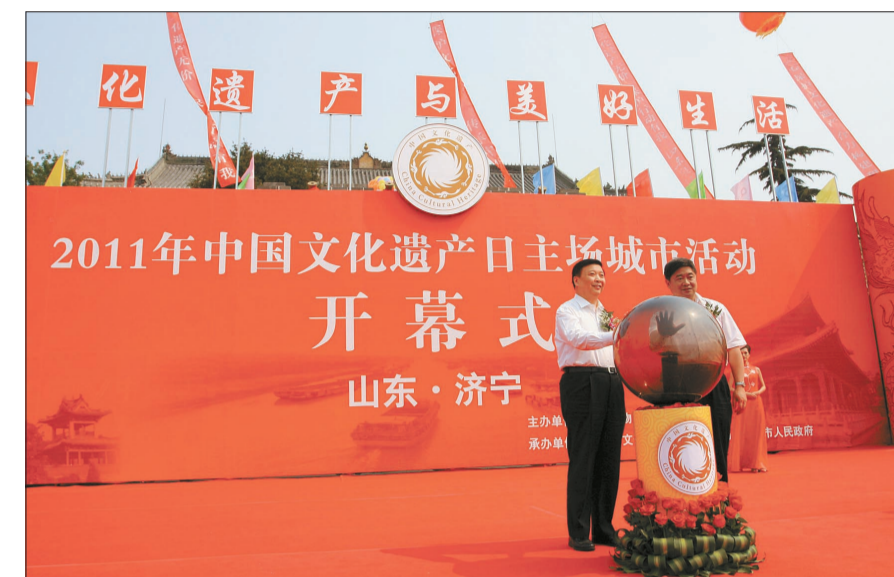
山东省省长姜大明、国家文物局局长单霁翔共同启动了文化遗产日开幕式按钮

6月11日下午,由山东省文物局主办、济宁市文物局承办的山东省文物保护成果展暨济宁运河文化展在济宁市