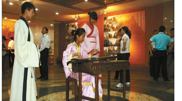
“中国历史文化名街”成果展上的古筝表演