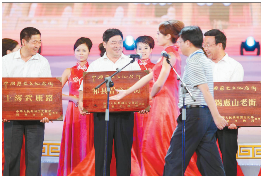
国家文物局局长单霁翔(中)、山东省副省长黄胜(右)、国家文物局文物保护与考古司司长关强(左)为入选街区授牌。