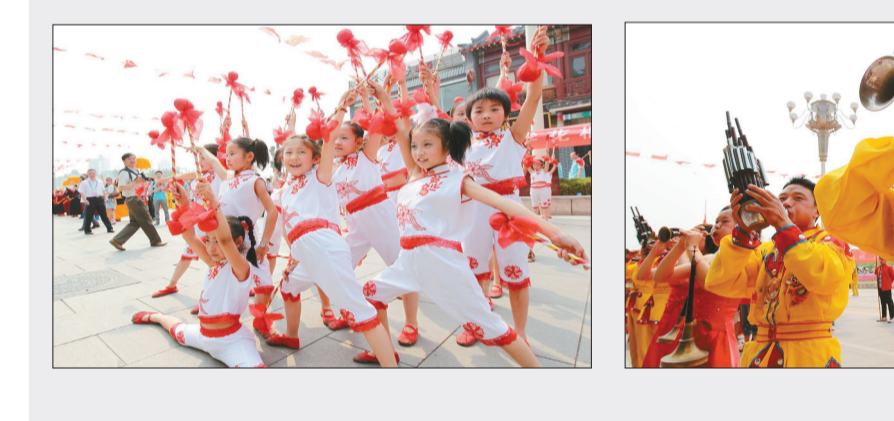
开幕式上的精彩演出

晚,由国家文物局主办,中国文物信息咨询中心、济宁市文物局、兖州文化旅游局共同承办的第三届全国青少年文化遗产知识大赛决赛在兖州一中礼堂落下帷幕。 国家文物局局长单霁翔表示,全国青少年文化遗产知识大赛是文化遗产保护领域的知名品牌,与新时期文化遗产保护理念——“代际传承性”与“公众参与性”相合,不仅通过比赛这种形式使得文化遗产的传承更加扎实,还让更多人走近文化遗产,了解其内涵。 自2009年开始,国家文物局委托中国文物信息咨询中心举办全国青少年文化遗产知识大赛,旨在向青少年宣传文化遗产知识,培养文化遗产保护意识,增强青少年对文化遗产的关注和热情,使更多的青少年感受文化遗产的独特魅力。大赛分为中学组和大学组,试题涉及政策法规、考古、博物馆、文物保护、世界遗产等领域的内容。本届大赛与往届相比,场景及环节设置更加活泼、生动。