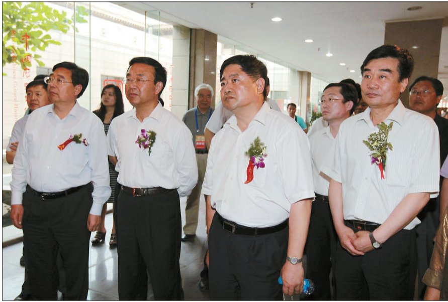
国家文物局局长单霁翔(右二)、山东省副省长黄胜(左二)、中国文化传媒集团总经理、中国文化报社总编辑刘承莹(右一)、济宁市委书记、市人大常委会主任张银川(左一)观看展览。