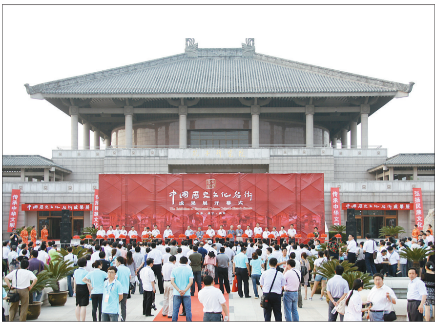
曲阜孔子研究院前“中国历史文化名街”成果展开幕式现场

“我们深感自豪,同时更觉使命在肩。在历史与现代、发展与继承的十字路口,我们将一如既往地秉承“保护第一、合理利用”的理念,按照历史文化遗产的申报要求,充分保护好惠山老街整体人文生态系统的原真性,留存好地域传统文化的精髓,使老街真正成为当地居民安居乐业的故乡,成为国内外旅游者所向往的精神家园。 (作者系中共无锡北塘区委书记、北塘区人大常委会主任、惠山古镇办主任。)