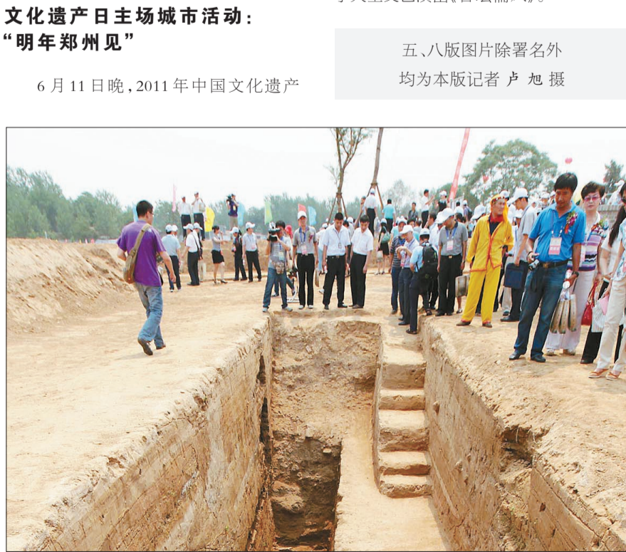
南旺枢纽工程遗址现场

文化遗产日主场城市活动：“明年郑州见” 6月11日晚,2011年中国文化遗产日主场城市活动在济宁市太白广场举行。