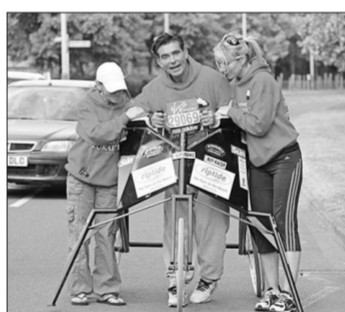
艰难行进中的艾迪

现年51岁的艾迪·基德出生于英国伦敦,一度是英国家喻户晓的摩托车特技骑手,他是许多世界纪录的创造者,曾于1993年飞车跨越中国长城,并夺得当年极限摩托车世界杯冠军。然而,一场事故过早地结束了艾迪辉煌的职业生涯。1996年的一次表演赛中,艾迪的摩托车撞上迎面而来的大卡车,头部和盆骨受到严重损伤,昏迷了整整6个星期。虽然最终挣脱了死神的魔爪,但艾迪