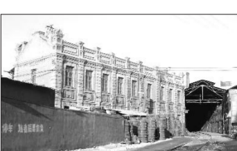
志兴福制粉厂账房旧址，现为北环商城使用。

1998年开始，笔者在对“三马”地区新马路、中马路、南马路上的3座高大巍峨的建筑进行调