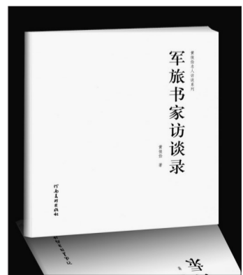
《军旅书法家访谈录》

中国人历来崇尚字画,将好的字画奉为艺术品欣赏并收藏。然而现在,进入寻常百姓家的许多字画,艺术含量基本为零,只能污染眼目毒害灵魂。就连那些动辄炒作到数十