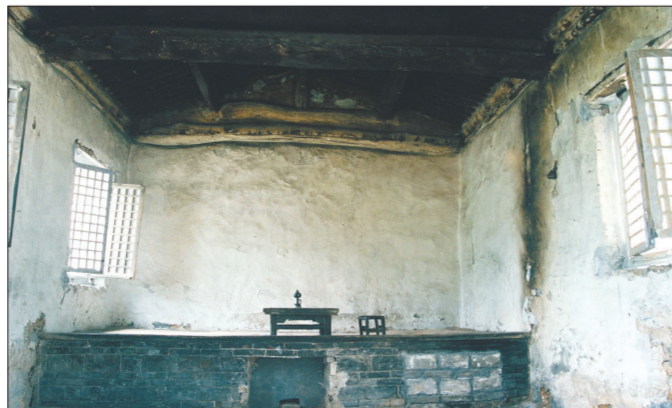
歌曲创作地“中堂庙”内景