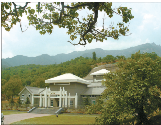
2009年6月修葺一新的《没有共产党就没有新中国》纪念馆

把红色文化、生态文化结合起来,既有利于传播红色文化,又有利于经济发展。革命老区保留下来的遗址和可歌可泣的革命故事,既是宝贵的精神财富,也是发展红色产业的重要资源,通过唱红歌、读红书、看红色电影、办红色专题讲座等文艺形式寓思想教育于文化娱乐,传播崇高思想境界和革命道德情操,让红歌永不落幕,让我们的共产主义事业代代相传!