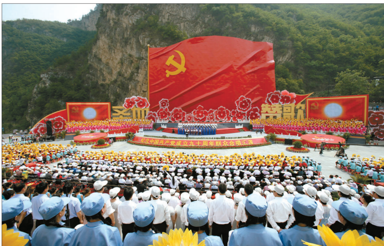
2011年6月20日,来自全国各地的歌唱团队齐聚堂上村参加红歌汇演。