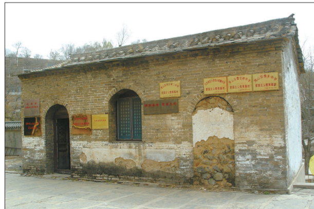
歌曲创作地“中堂庙”外景