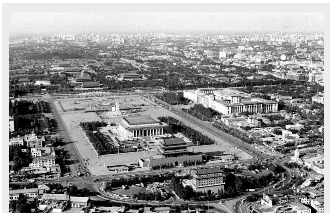
这是古老中国高贵头颅上的那一抹中缝，人们都称它为——中轴线。从这里，人们可以读到一个民族的苦难与辉煌。1949年2月3日，正是春节期间。中国传统的大年初六，庄严的中国人民解放军北平入城式在这里举行。伴着北平群众的欢呼声，人民解放军沿中轴线，一路走进北平城。日前，北京市中轴线申报世界文化遗产工作已全面展开。图为俯瞰北京中轴线(资料照片)。(新华社发)

的村落——五一村。1927年“4·12”政变后，中共的处境异常严峻。党内出现一股左倾盲动主义思潮，在条件不