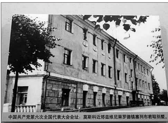
莫斯科郊外中共六大会议(资料图片)

造高架时，有关部门考虑到二大在中国革命的历史上具有重要意义，因此特地为会址让道，于是我们今天看到二大会址坐落于上海市静安区美丽的延中绿地上。