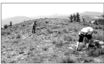
张家口长城五连墩

有专家评价，此项《规划》是未来5年文物博物馆事业发展的战略安排和行动纲领，将为促进文化遗产事业科学发展，推动文化遗产强国建设发挥重要的引领作用。(陈城文)