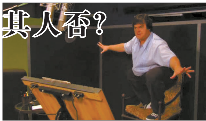
熊猫阿宝的背后是搞怪的杰克·布莱克。