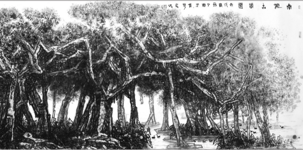
《南海古风图》(国画) 142.5厘米×364厘米 2006年 李宝林