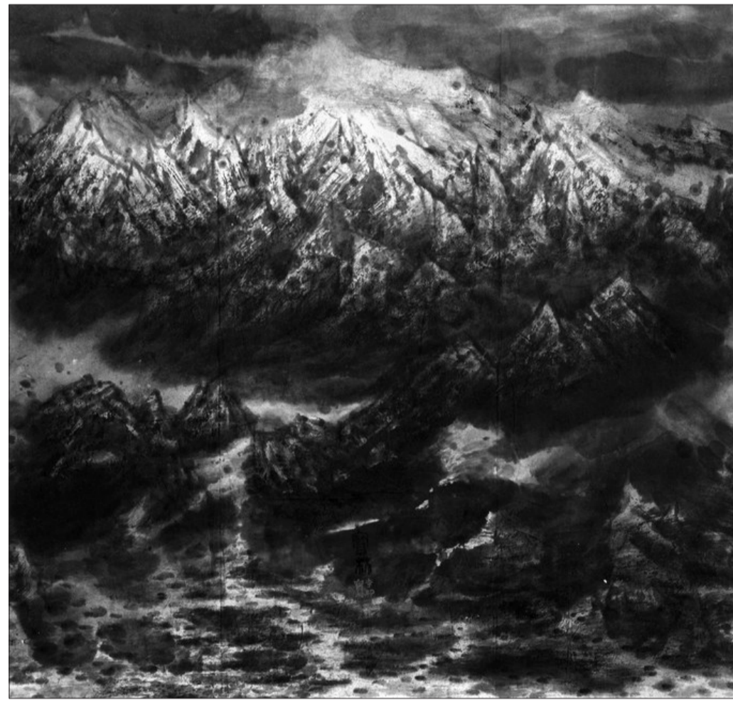
《大山的回响》(国画) 117厘米×123厘米 2001年 李宝林