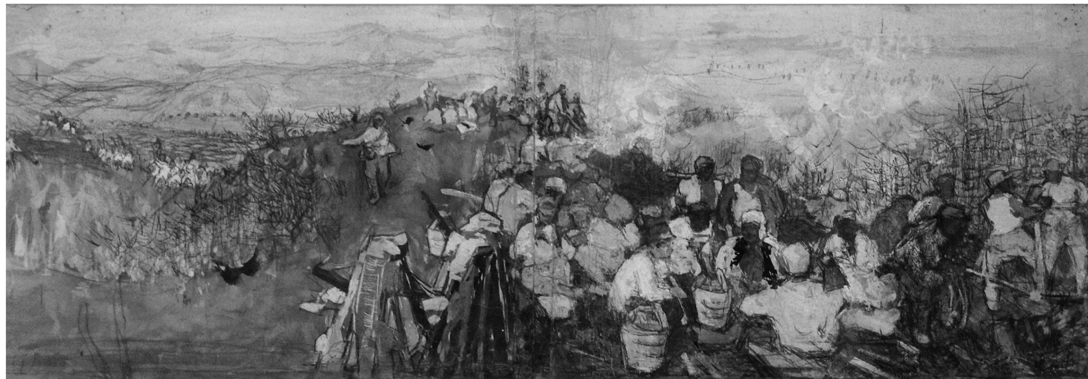
《南泥湾》创作草图正式定稿 74厘米×27厘米

红色题材油画兼具艺术价值与历史价值的双重属性,内容和形式深深地刻着时代印记,具有强劲的市场需求,在艺术品市场犹如后起之秀。自1994年刘春华的《毛泽东去安源》创造604万元高价之后,红色题材艺术品收藏进入了一个新的阶段。2007年中国嘉德春季拍卖会上陈逸飞的《黄河颂》创下内地红色经典巅峰纪录。2009年靳之林的《南泥湾》也以1344万元的价格尘埃落定,创造了靳之林作品新纪录。纵观2011年艺术品市场,同时鉴于上文提到的艺术和历史价值,该份额产品《南泥湾》创作素材稿组合蕴藏着巨大的收藏和投资价值。目前该份额产品虽处于一个相对较低的市场价位,但由于它是特殊历史环境下创作的珍品,雪藏民间50载后,其诸多价值将会大放光彩。