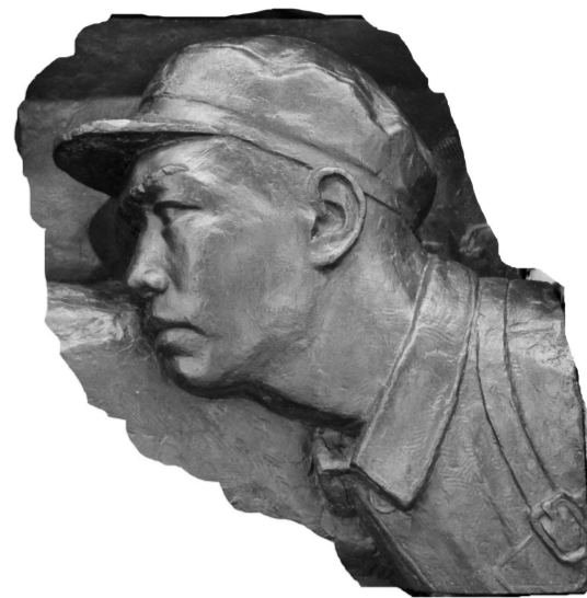
《胜利渡长江》战士头像 铸铜 36厘米×33厘米 1958年

珍稀性是份额产品《开渠雕塑》的一大亮点。在刘开渠创作过程中,曾脱出两套石膏模具,一套用于纪念碑雕刻,另一套用于收藏,后来根据石膏原模铸了数套铜质头像,该模具目前已经捐赠。由于数量有限,份额产品的珍稀性非常明显,这种特性大大增加了份额产品综合价值的分量。