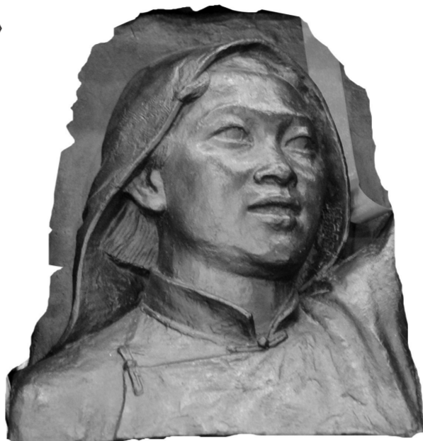
《欢迎解放军》妇女头像 铸铜 36.5厘米×27厘米 1958年

刘开渠是中国当代雕塑艺术的先行者,在雕塑创作和理论研究方面都有非常深厚的艺术造诣。他曾经留学法国,师从法国雕塑大师。他的作品在西方写实的基础上,融合中国传统雕塑中简练、单纯的表现方法,造型严谨朴实,手法细腻含蓄,人物神情完备,气韵十足,具有非常浓厚的绘画性和意象性,形成了自己独特的中西合璧风格。人民英雄纪念碑浮雕表现了重大历史事件中的典型场景和典型形象,雕