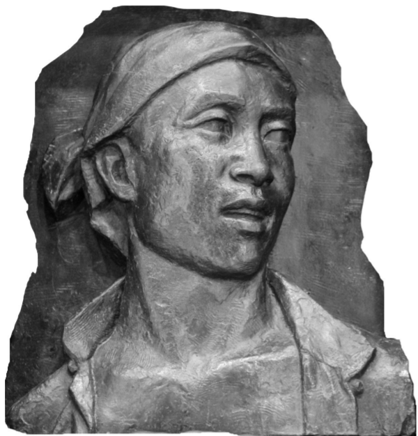
《支援前线》农民头像 铸铜 38厘米×30.5厘米 1958年

4. 内容简介: 落成于1958年的人民英雄纪念碑底座正立面,镌刻着3幅气势恢弘的汉白玉浮雕,其中《胜利渡长江》为主图浮雕,辅以前《支援前线》和《欢迎解放军》两组装饰性浮雕,它们面向国旗和天安门城楼,是共和国极具标志性的艺术作品,代表了新中国成立以来甚至整个20世纪雕塑作品的较高水平。纪念碑建造期间,雕塑大师刘开渠担任设计处处长和艺术组组长,并由他主持完成了上述3组浮雕的创作,当时共脱出两套人物头像石膏模具,一套用于上述浮雕创作,另外一套由其收藏。后来根据刘开渠收藏的石膏原模铸了