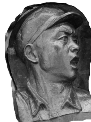
《胜利渡长江》指挥员头像 铸铜 37厘米×27厘米 1958年