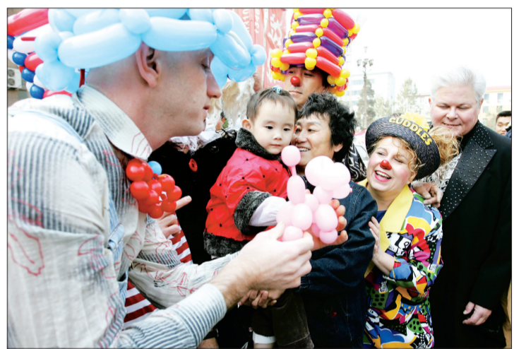
2009年第十二届中国吴桥国际杂技艺术节大型广场公益演出在河北省石家庄市文化广场上演。美国基石公司的演员们为群众表演气球服饰秀。

以高难度著称的中国杂技因没了新鲜感不受国际市场追捧,西方评委过多导致国际赛场上金牌旁落……说起来,还是中国在国际杂技界的发言权不够。