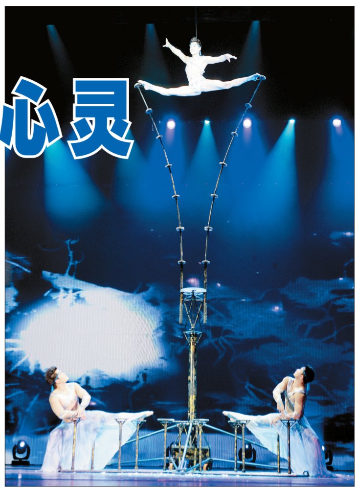
中国杂技团的杂技《揽梦擎天——摇摆高拐》剧照。

中国吴桥国际杂技艺术节设“金狮奖”,始创于1987年,每两年举办一届,至今已举办10届,被誉为世界东方国际杂技大赛场。