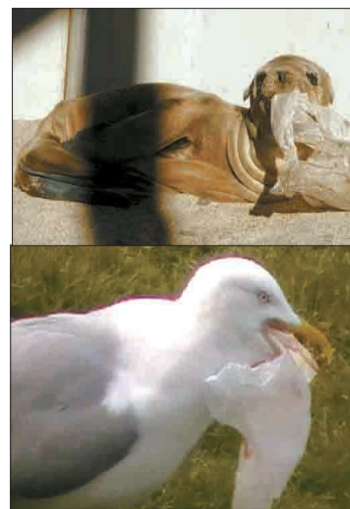
许多海狮、海鸥等动物因误食塑料袋而丧生。

WRAP表示，2010年英国的塑料袋使用量超过了3.33亿，数量在过去5年中出现首次增长。在2010年英国大选前夕，海洋协会游说主要政党，获得了各党派对海洋垃圾管理的保证。但由于政府的落实不够给力，许多垃圾减排的行动无法得到真正实施。协会发言人表示：“尽管一些大型零售商正在通过收费等方式逐步减少使用塑料袋，但仅仅依靠他们是不可能彻底解决污染问题的。”“今年的调查结果显示出塑料垃圾使用回升势头让人不可接受，公众对环境的漠然让人心寒。我们必须更强力地在全国范围内限制塑料袋的使用。”