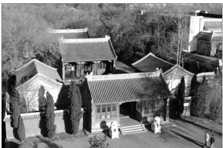
位于黑龙江省齐齐哈尔市的寿山祠

15营新军即已初具规模,但车马器械尚未备齐。不料,黑龙江将军恩泽遽然病故。恩泽死前曾上疏建议,由寿山暂掌将军印。光緒二十六年(1900年)正月,清廷命寿山署黑龙江将军。他深知守疆任重,孜孜求治,除弊去奸,整军治武,不遗余力,亲手制定行阵操法,绘制军事要隘图,制定赏罚条例颁发给将领。他特别重视选拔人才,即使对低级官吏也切实考核,不遗漏俊逸之才。寿山身为黑龙江地区的最高军政长官,励精图治,尽心竭力,使黑龙江的吏治、军务、边防都有明显的改进,财政亦稍有宽裕,在军民中博得很高声誉。