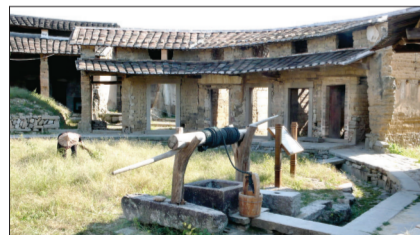
漳州市华安县齐云楼是目前发现的现存最古老的土楼。居民已经全部迁出,采取了“冻结式”保护方式。