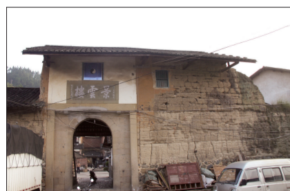
位于平和县九峰镇黄田村的景云楼,正门的土墙已经部分倒塌。