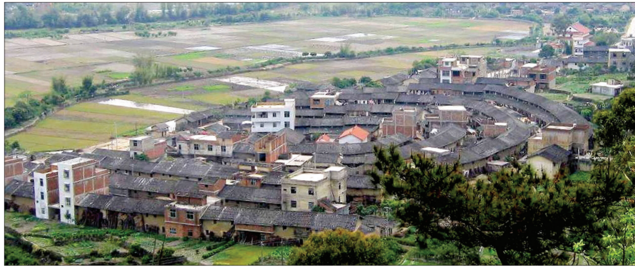
如今的半月楼,楼内空地上和楼墙外,已崛起了一座座红砖白瓷的新建筑,周围的不少树木也遭到砍伐。

村中的另一座土楼——咏春楼前方后圆,造型独特。记者看到,土楼门口的荷塘边上搭着一座猪圈,由于经常