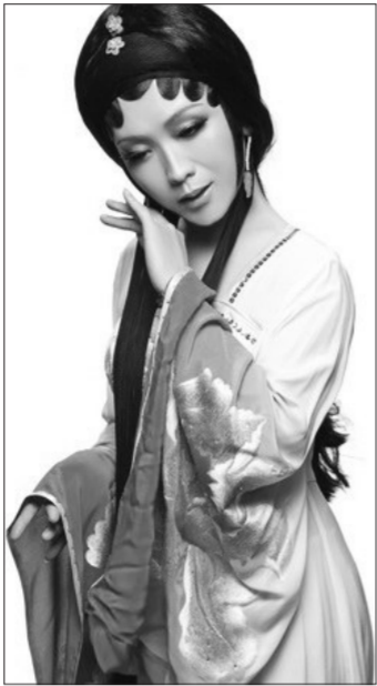
李玉刚的女装扮相

悉尼，“观众完全全沉醉了。”“红楼花情”“楚歌荡气”“盛世霓裳”“东方神韵”4个篇章，令近2000名中澳观众欣赏到一台充满中国元素和韵味的绚烂画卷。最后，当李玉刚脱下戏装，以男儿本