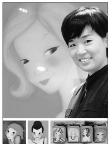
陆心元和她的艺术商品

垫、行李箱包等丰富多彩的商品系列，以陆心元的画作作为模板推出的艺术商品已经有近500种之多，而她笔下的调皮鬼小绿、奥黛丽等形象更是备受韩国人，尤其是韩国女性喜爱。一位陆心元的粉丝表示：“陆心元笔下的形象不仅可爱，而且会讲故事，简单的形象却能表达出女性的心理，看到这些人时，心情都会随之好转。”不久，陆心元的公司还将推出鞋子、手袋等商品，今年冬天她还准备将这些艺术商品推广到法国、意大利市场。