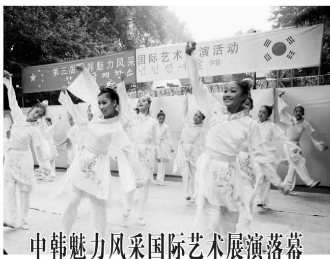
中韩魅力风采国际艺术展演落幕