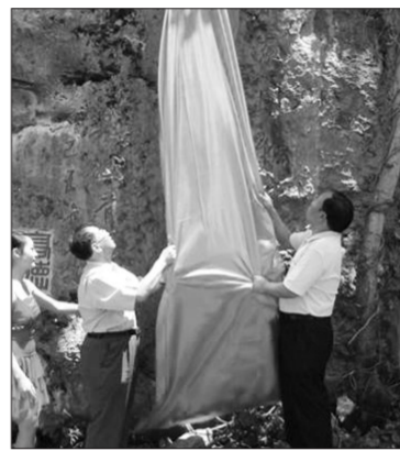
全国政协委员、华夏文化纽带工程组委会副主任委员刘亦铭(左)为华夏文化纽带工程指导的生态文化建设项目揭幕

我们多从科学治理垃圾和以景治污、以景治荒、以景治贫等具体事情入手, 推进真善美生活方式的建立, 这就体现了把中华和谐文化转化为实践、落实到基层这一“天地人和”行动的根本宗旨。因此, “天地人和”行动应当以开展科学处理垃圾问题讨论和以景治污、以景治荒、以景治贫调研论证工作为基础, 进一步推进以建立真善美生活方式为导向的具体的实事, 甚至小事, 从而真正为弘扬中华和谐文化、构建社会主义核心价值体系做出贡献。