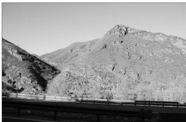
北京市房山区佛子庄乡中亲园选址地未筹建前的状况及项目全景规划图