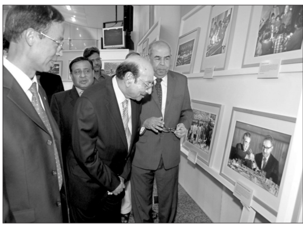
巴基斯坦信德省省长阿里观看图片展