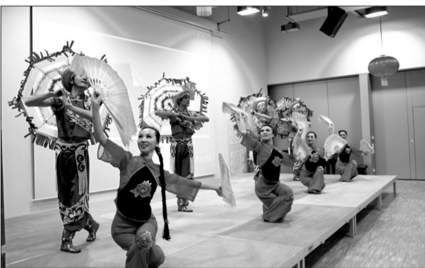
喜庆欢快的《陕西大秧歌》