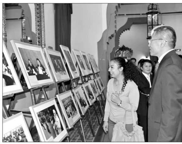
埃及观众观看图片展

为了在海外掀起纪念辛亥革命100周年的热潮,配合新中国成立62周年庆祝活动,文化部外联局筹备制作了“世纪回眸——纪念辛亥革命100周年图片展”,以人文和民生的视角展现中国百年来的沧桑巨变和辉煌成就。自9月中旬以来,展览在152个中国驻外使领馆和中国文化中心相继推出,吸引了大批驻在国主流社会和侨界观众前来参观。