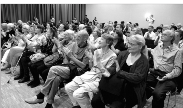
德国观众对演出报以热烈掌声