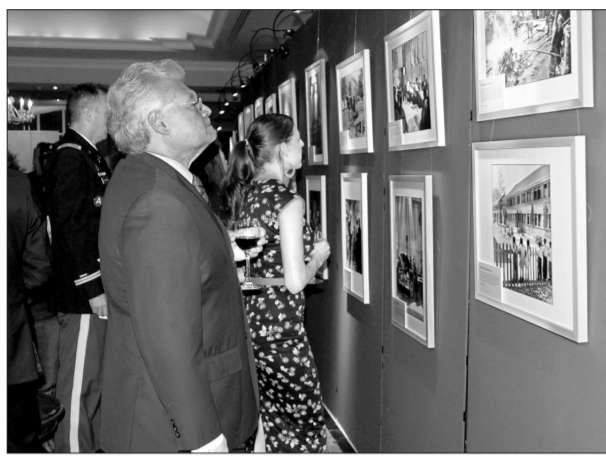
多国驻埃塞俄比亚使节观看图片展