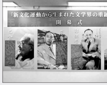
马耳他观众一家三口观看图片展

据东京中国文化中心主任石军介绍,展览通过400余幅历史及文献图片展示中国新文化运动的发展轨迹,再现了鲁迅、郭沫若、茅盾、巴金、老舍、曹禺、徐志摩、郁达夫、朱自清、艾蕻10位文学大师的成长历程,诠释了他们不朽的文学名作。新文化运动纪念馆副馆长何洪说,新文化运动吹响了以民主、科学为主旋律的思想启蒙的号角,提倡新文学的文学革命是新文化运动最坚实的组成部分,将中国文学推进到一个崭新的阶段。