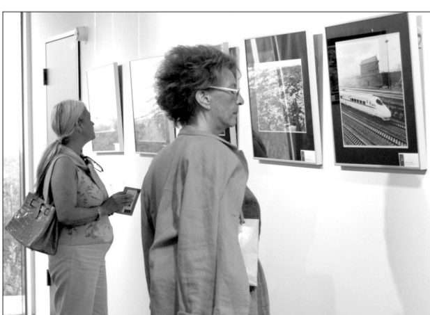
德国观众观看摄影艺术作品

近日,中国驻德国大使馆和柏林中国文化中心迎来了陕西省榆林市民间艺术团。9月28日、29日,中国驻德国大使馆举办了国庆招待会,多位来自德国社会各界的重要宾客以及德国社会、外交使节、海外侨领和留学生代表应邀出席。陕西省榆林市民间艺术团的演员们为观众献上了具有浓郁乡土气息和陕北地方特色的歌舞,精彩的节目博得了各国来宾的热烈掌声和交口称赞。