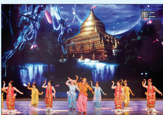
图二 由缅甸艺术团、老挝艺术团、柬埔寨艺术团表演的外国舞蹈荟萃《水脉久相融》表现了湄公河流域各国人民生生不息的文化脉络和亲如兄弟般的美好情谊。