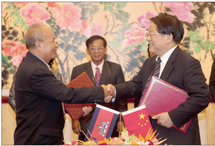
10月10日,中国文化产业部长蔡武与柬埔寨文化艺术部部长亨柴签署了《中华人民共和国文化部与柬埔寨王国文化部文化合作协定2011—2013年执行计划》。