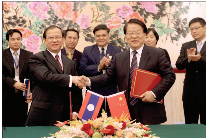
10月10日,中国文化产业部长蔡武与老挝新闻、文化与旅游部部长波显坎·冯达拉签署了《中华人民共和国政府与老挝人民共和国政府文化合作协定2011—2013年执行计划》。