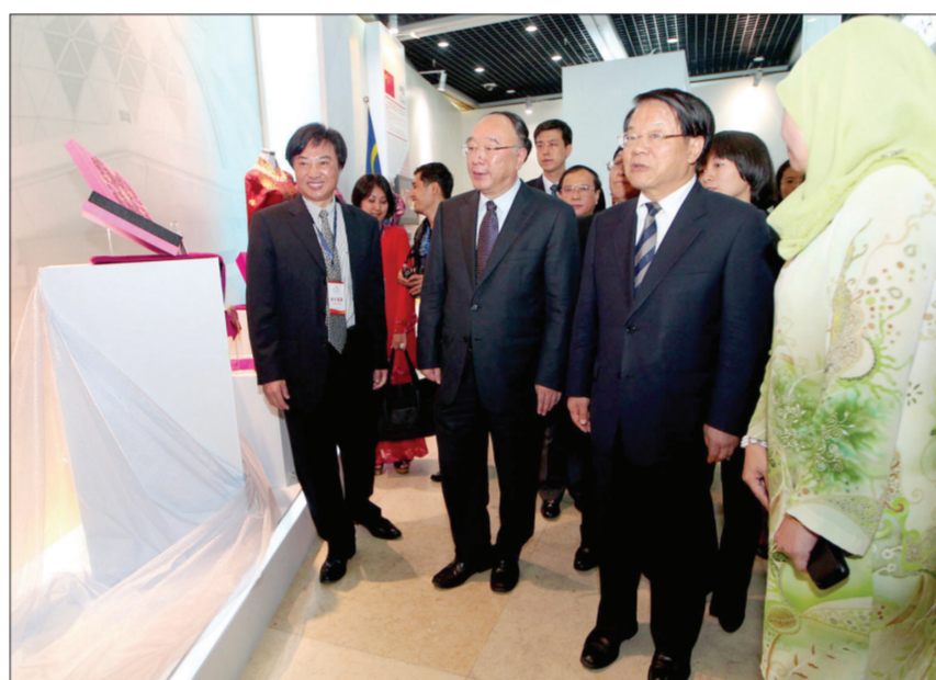
10月10日,“美美与共——中国—东盟服饰展秀”在重庆三峡博物馆开幕。图为文化部部长蔡武、重庆市市长黄奇帆参观展览。