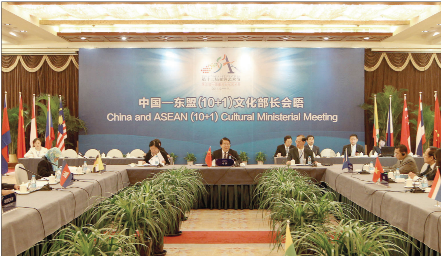
10月10日,第十二届亚洲艺术节中国—东盟(10+1)文化部长会晤现场。