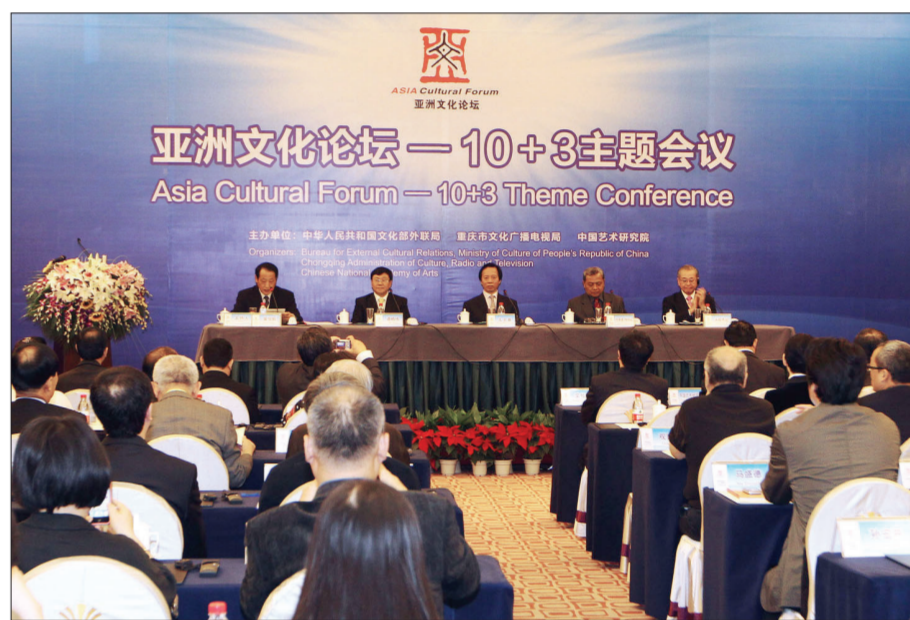
10月10日,第十二届亚洲艺术节重要活动之一——亚洲文化论坛—10+3主题会议开幕。中国文化部副部长王文章参加开幕式并致辞。

2011年是中国—东盟建立对话关系20周年,这使今天在重庆的会面更具有特殊的意义。