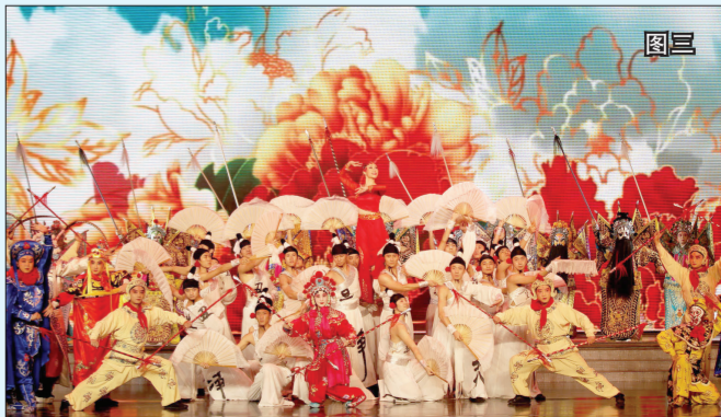
图三 由重庆市歌舞团、重庆市川剧院、重庆市京剧团演出的戏曲舞蹈《粉墨印象》。