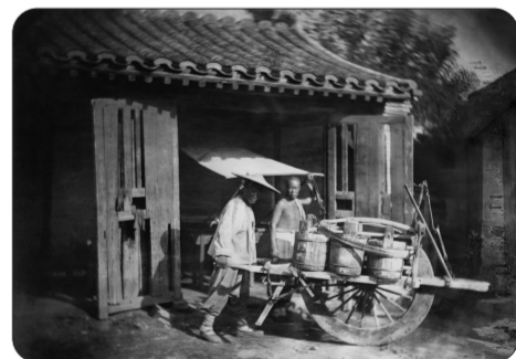
夏日的运水工与小型运水车,北京,1861年 后面的房子为水井所在处,北京俗称“水窝子”。