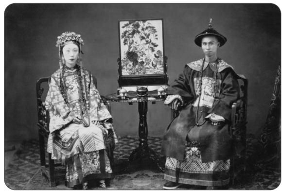
清朝官员夫妇,广东,1860—1862

1912年逊位时,溥仪还只是一个不到6岁的孩子,享受着“皇室优待条件”,在紫禁城中的生活可以说是无忧无虑。在故宫保存的溥仪照片中,甚至有一张是他站在千秋亭西侧房顶上。