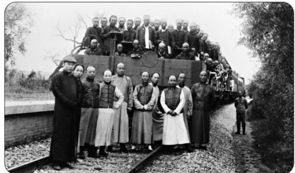
京张铁路修成时詹天佑与同事合影,1909年2月

京张铁路是中国首条由中国人自己筹资、勘测、设计、施工建造并投入营运的铁路,由詹天佑(车前右第三人)任京张铁路会办兼总工程师,1905年9月开工修建,于1909年建成。