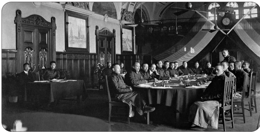
南北议和会议,上海,1919年2月20日

南北议和会议在上海德国总会召开,南方军政府代表为唐绍仪,北京政府代表为朱启铃。由于南北议和有碍日本在华利益、有悖段祺瑞“武力统一”中国的意图,北京政府只是迫于中外压力才同意,因此和谈注定只能以失败而告终。图为会议现场。