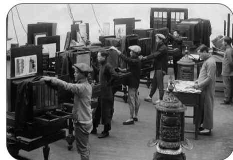
商务印书馆照相制版部,上海,20世纪20年代

20世纪20年代的商务印书馆照相制版部内景,作为当时国内最大的出版机构,商务印书馆有多台照相制版机器可以同时工作,满足繁忙的业务需要。