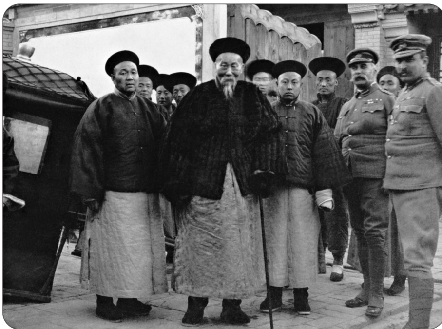
准备前去谈判的李鸿章,北京,1900年

李鸿章称自己为“大清朝的裱糊匠”,在八国联军占领北京后,他被清政府委任为“钦差大臣便宜行事”与各国谈判。这是李鸿章刚抵达英国驻华使馆时的情景,迎接他的是英国远征军司令阿尔弗雷德·盖斯利将军(右二)。