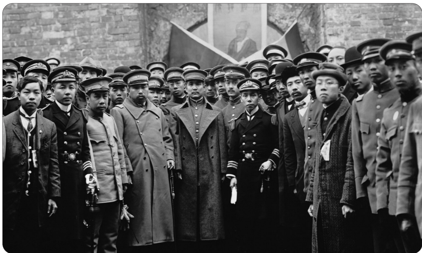
孙中山等谒祭明孝陵,南京,1912年2月15日

孙中山在清帝退位3天后,着一身戎装携南京临时政府官员谒祭明孝陵。前排左三为南京临时政府南京卫戍总指挥徐绍桢,左四为陆军总长黄兴,左五为临时大总统孙中山,左六为海军总长黄钟瑛,左七是教育总长蔡元培。一个月后,临时政府即宣告解散。