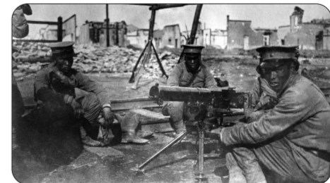
清朝军队的马克沁机枪,1910年10月