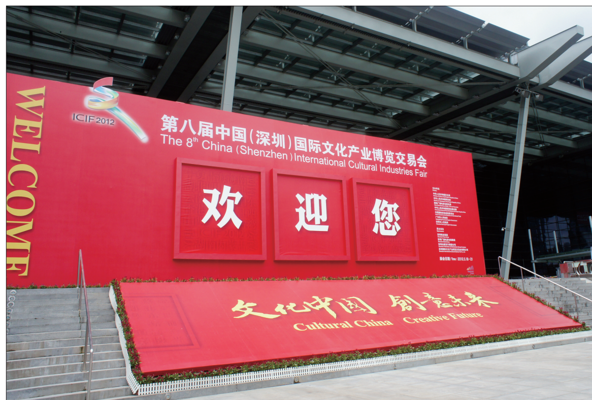
5月18日上午,第八届中国(深圳)国际文化产业交易博览会在深圳会展中心开幕。上图为深圳文博会主展馆,右图为深圳文博会国际采购对接区现场。