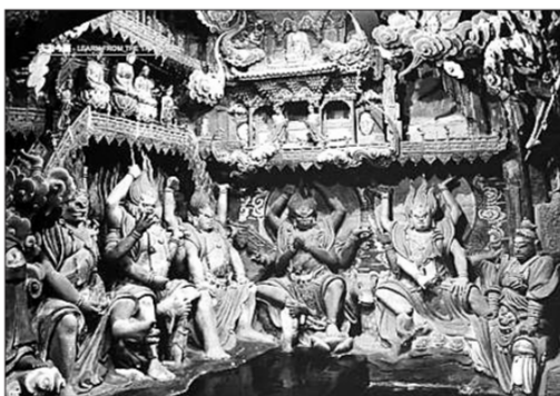
绵山彩塑被专家认为“可填补中国雕塑史的空白”。