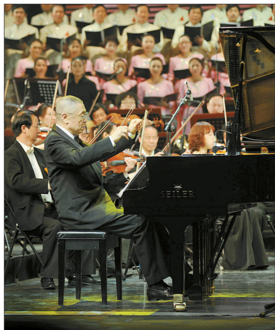
著名钢琴家刘诗昆演奏的钢琴协奏曲与合唱《黄河》