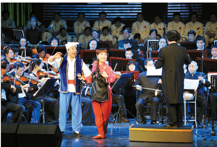
唐户刚《十二把镰刀》

任勇还深有感触地说：“演员真应当到基层中去，虽然有时当地的条件确实很差，但从乡亲们脸上、笑容中