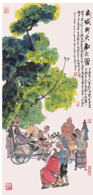
京城街头剃头图(国画)