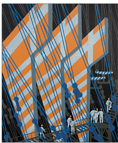
工业时装(版画) 宋恩厚

了一种对于过往生活久违的感动。“感谢这个展览，它提供了关于一段特殊历史时期的国家记忆。从某种意义上说，它是一种抢救式呈现。”肖丰说。