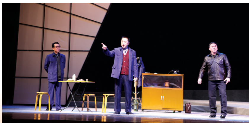
吕剧《百姓书记》剧照