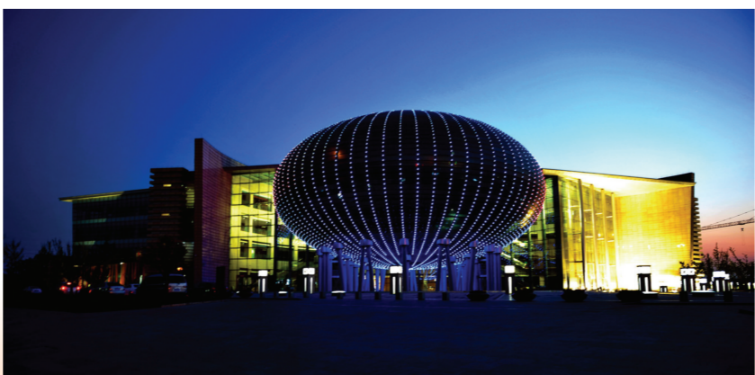
寿光文化中心效果图