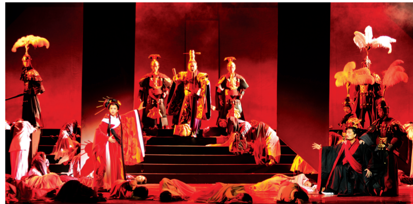
歌剧《赵氏孤儿》剧照

社会文化艺术创作方面,全市共创作各类群星奖备选作品35件,其中,17件作品入选省文化厅“喜迎十艺节”冲击群星奖作品初赛;鲁西南吹打乐《唱大戏》、《大唐巾帼》获第四届“泰山文艺奖”戏剧类二等奖并在中央电视台戏曲