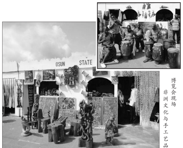
博览会现场 非洲文化与手工艺品