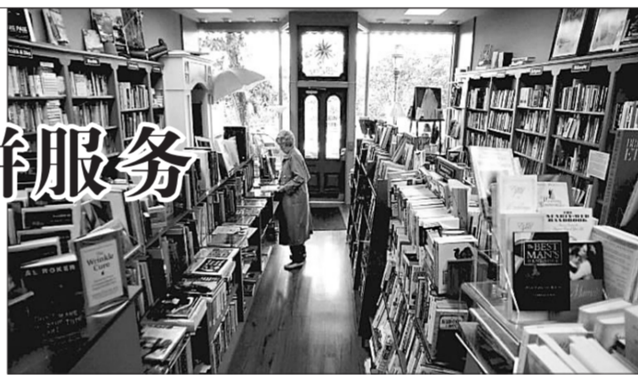
美国现存最老书店——摩拉维亚书店

的索恩霍夫外文书店成立于1856年,遭遇过经营危机的这家书店虽然已换了东家,但仍然保留着独立经营权。目前,索恩霍夫外文书店推出了强大的网上销售平台以增加外文电子书的销售。此外,该书店还利用完备的网络平台举办网络外语培训课程,受到读者的欢迎。位于该州的另一家老牌书店安多佛则重视加强员工素质的培训,同时采用最新的电脑销售管理系统,为读者购书提供最大方便。