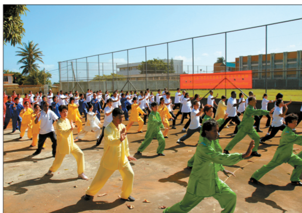
毛里求斯共练二十四式太极拳。

此外,为迎接2012“世界太极拳月”,毛里求斯中国文化中心还组织了一系列活动,在毛里求斯推广太极拳。尤其5月27日的2012“世界太极拳月”展示交流活动中,中国文化中心太极班