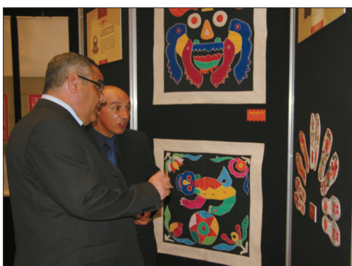
马耳他观众观看湖北省非物质文化遗产展。

6月7日晚,由马耳他中国文化中心举办的湖北省非物质文化遗产展开幕。刺绣、挑花、布贴、西兰卡普、剪纸、皮影悉数登场,向马耳他观众展示了湖北省独特的荆楚文化和非遗保护成果。