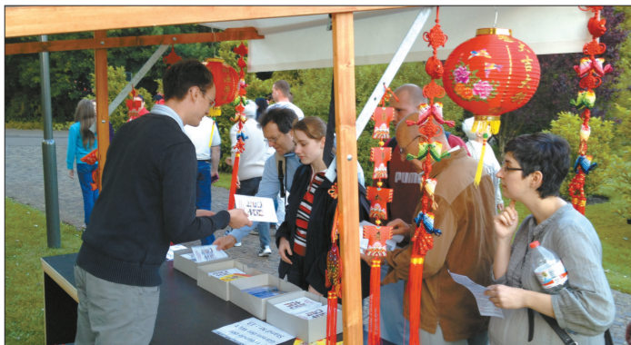
“世界公园”建园二十五周年庆典活动中,许多德国观众在中国文化中心展台前咨询。

一亮相就吸引了无数目光。他们和柏林中国留学生的民族时装队一并在“世界公园”多个场所演出,精彩的表演赢得了德国观众的热切掌声和欢呼声。此外,中国文化中心还在公园内设立了信息咨询台,向游园的德国观众分发介绍柏林中国文化中心的资料和课程表。(本报驻德国特约记者 王滢)