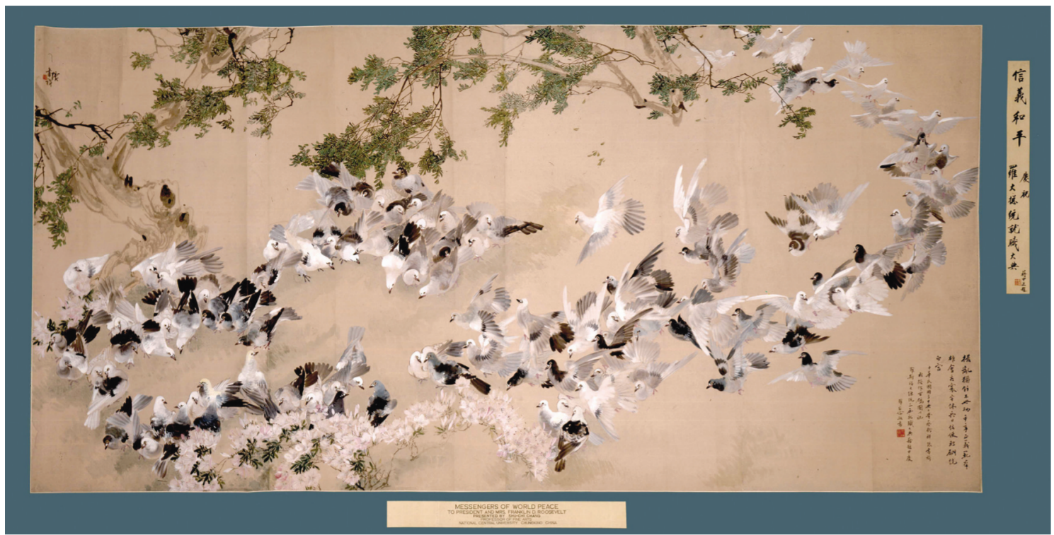
张书旂作品近日在浙江美术馆展出，因其代表作《百鸽图》，由美国罗斯福总统图书馆博物馆收藏。