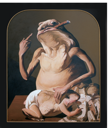
知识就是力量(油画) 赵博

赵博认为，戈雅、杜米埃的伟大，在于他们的艺术打破常规，充满想象力。一个艺术家不光是好的手法，还要有独到的创造力，