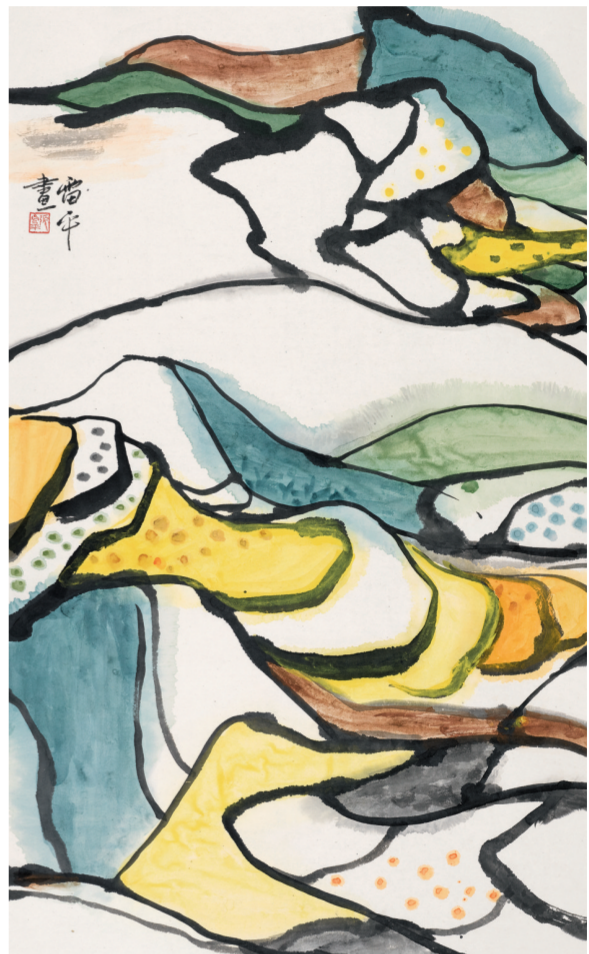
彩色的山田(国画) 169厘米×113厘米 2009年 张雷平

单，把灰色的块面画得墨韵十足，由此体现用笔的洒脱灵动和用墨的浑厚拙朴。 美术评论家尚辉认为，相比于现代水墨，张雷平没有完全消解中国画的水墨语言，而是通过碑学用笔的线条与笔墨精神提升了现代性的品格与高度；相对于传统中国画，她的作品充满了清新、明快、简约的现代审美意趣，且这种现代性的节奏感又饱含传统笔墨的气韵丰神。这种在现代之中国归的传统和在传统之中弥散的现代精神，无疑是中国当代文化的一种表征。