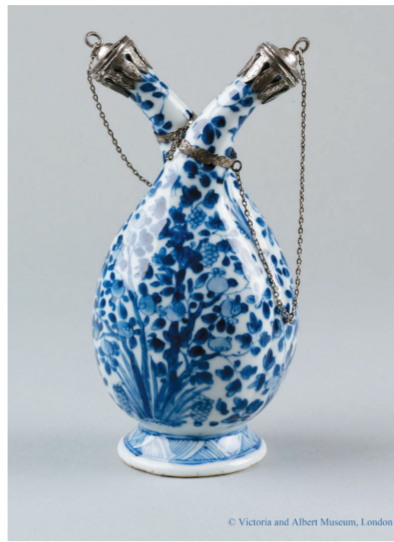
青花带银配件双颈油醋调味瓶 中国江西景德镇 约1690年至1700年 约1700年在荷兰加装配件 J.A.塔尔克遗赠 维多利亚与艾伯特博物馆藏

正如大英博物馆馆长尼尔·麦克格瑞格所言，作为最早的全球性商品，瓷器因其实用性与审美性被广泛接受，已经成为中西交流中的一种语言，瓷器的历史也已经成为全球对话历史的一部分。(朱永安)