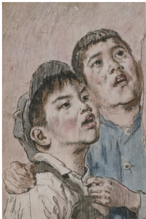
高唱东方红 局部 (国画) 1949年

中国画史上的传统派画家大多没有接受过系统的美术院校教育，而是由师徒传承而成长为一代大家。蒋兆和先生早年在上海时是设计师、油画家和雕塑家，后成为融汇中西的中国画家，他正是一位没有接受过任何美术学院训练而自学起家的艺术大师。这源于蒋兆和先生艺术的敏锐感觉和对创作规律的把握，此外更多的是他不断地在向日常生活观察，向现实社会学习。正因为如此，蒋兆和的水墨人物画从创作之初便把关注焦点放在普通民众的身上。1936年，蒋兆和从繁华的上海回到了相对封闭的重庆，