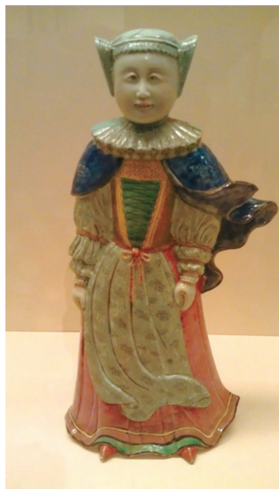
犹太女子塑像 中国江西景德镇 约1735年至1745年 内莉·艾奥迪尼斯夫人捐赠 大英博物馆藏

此盘上的图像完全仿自尼古拉斯·维格尔斯的版画《浸泡阿喀琉斯》，画面中，婴儿阿喀琉斯——未来特洛伊战争中的希腊英雄，被他的母亲忒提斯和两个侍从从浸入冥河中，以确保阿喀琉斯除被握住的脚踵之外的身体能刀枪不入。