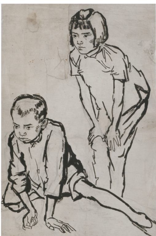
《流民图》画稿局部 1943年 蒋兆和

拿起毛笔、背起画板走向民间街头。这一年正赶上四川发生了罕见的旱灾，蒋兆和的早期水墨人物画《朱门酒肉臭》就诞生在重庆的街头。同时期创作的水墨作品《施舍一个》、《街头小子》、《洗衣妇》等均为首次展出，这些源于生活的作品都真切地表达了蒋兆和“为民写真”的创作思想。