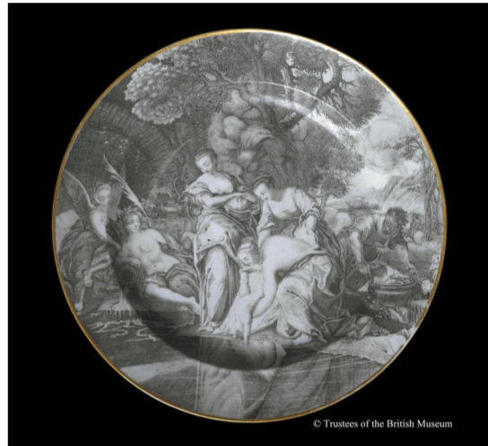
浸泡阿喀琉斯图餐盘 中国江西景德镇 约1737年至1740年 奥古斯都·沃拉斯顿·弗兰克斯爵士捐赠 大英博物馆藏

调味瓶最初是礼拜仪式用品，用来盛圣水和圣酒，或其他教会礼拜仪式的药油。直到17世纪末，法国、德国和荷兰人的餐桌上才普遍使用调味瓶。该款双颈调味瓶的造型源自玻璃容器，瓶内通过一个垂直隔板被分隔为两个独立的空间，分别放油和醋，通过两个向外弯曲的长颈倒出。此瓶上的青花纹样是中式，其风格却受到欧洲的影响。