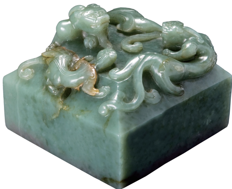
清乾隆青玉瑞龙玉玺

国内拍卖行中，北京保利2011年秋拍推出的“清乾隆六十年白玉御题诗‘太上皇帝’圆玺”以1.61亿元的成交价称霸目前玉器市场。据