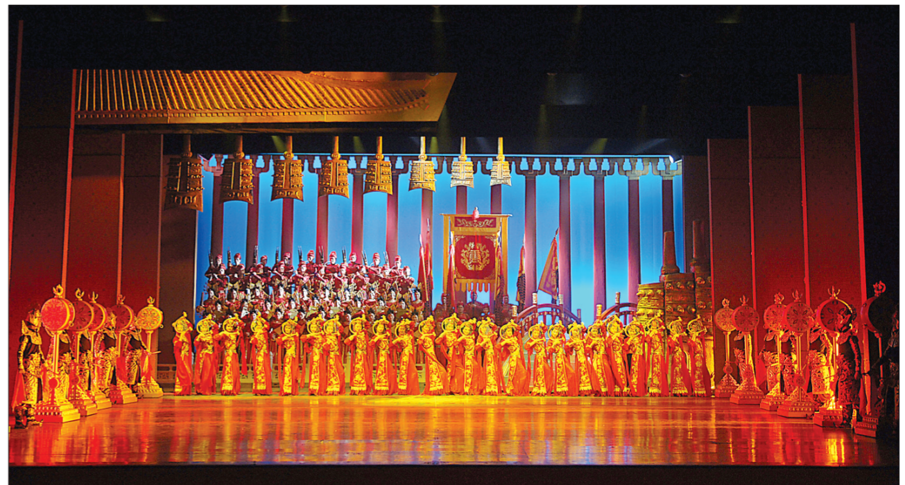
获第五届陕西省艺术节多项大奖、对外交流优秀剧目《大唐赋》赴北京演出