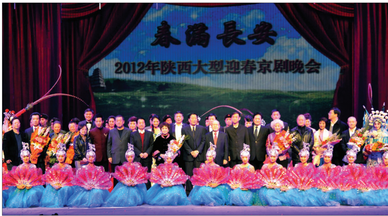
陕西演艺集团成功承办2012年陕西大型迎春京剧晚会《春满长安》

6月28日,中共陕西省委副书记、省长赵正永,省委常委、副省长、省委宣传部部长景俊海,副省长郑小明,与省政府办公厅、省委宣传部、省发改委、省财政厅、省文化厅、省人社厅、省国土资源厅等政府部门负责人来到陕西演艺集团陕西爱乐团进行调研。肯定发展成绩、了解实际困难、关心当前建设情况,赵正永的亲临指导让陕西演艺集团上上下下备受鼓舞。