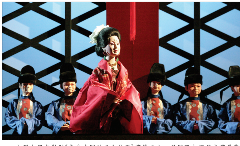
大型木偶皮影剧《来自中国的三个传说》获第二十一届中国国际木偶艺术节最高奖项“最佳剧目奖”

其间邀请知名专家召开研讨会近50次,不断提升品质和内涵,终于把好看的《长安》呈现在广大观众面前。