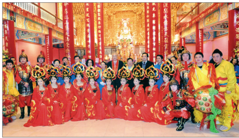
大型杂技主题晚会《长安百戏》赴台湾演出,吴敦义和集团杂技艺术团演职人员合影留念

《长安》是陕西省委宣传部、省文化厅重点扶持项目,也是陕西演艺集团2012年主推的精品剧目之一。陕西爱乐乐团团长、《长安》执行总监及作曲崔炳元表示,《长安》的诞生是乐团6年来不断调整自我、精心打磨的成果,从2006年着手策划开始,不但四易其名,而且