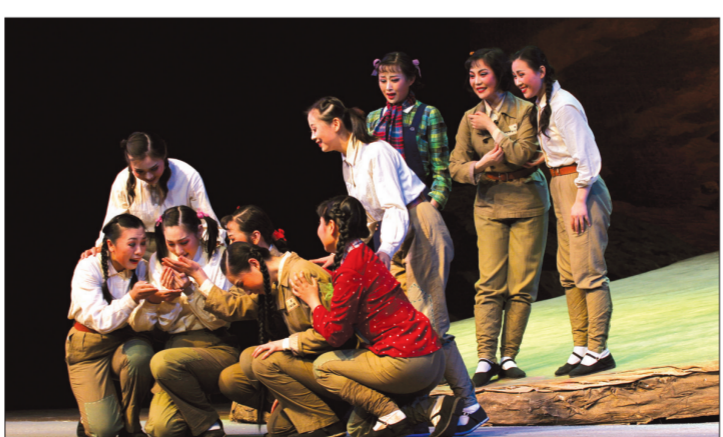
吕剧《补天》剧曾获首届泰山文艺奖一等奖,第九届山东省艺术节“精选剧目优秀演出奖”。

近年来,山东相继推出了吕剧《苦菜花》、《补天》,山东梆子《画龙点睛》、《山东汉子》,柳子戏《江姐》等一批地方戏优秀作品,收获了“五个一工程”奖,国家优秀保留剧目大奖、国家舞台艺术精品工程奖、文华大奖、文华新剧目奖等多项国家级大奖,带动整个山东地方戏呈现出创作、演出两繁荣的景象。