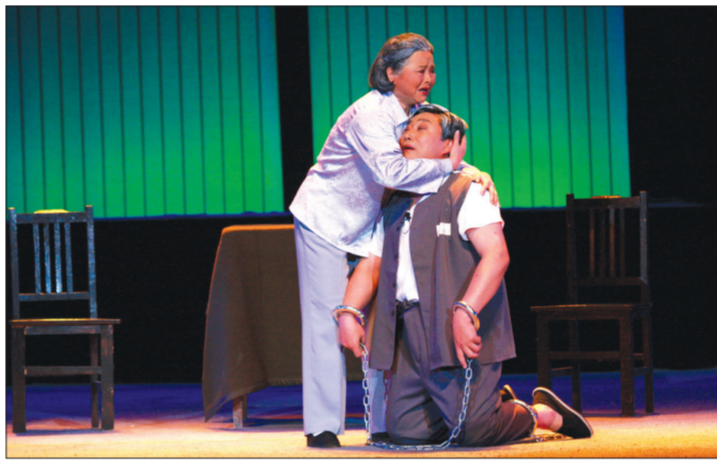
莱芜梆子《儿行千里》剧照。该剧今年已在省内外巡回演出180余场,观众达18万余人次。

在体制机制创新的同时,山东省还积极推动地方戏曲保护传承方式方法创新。由于多种原因,有些地方戏剧种在一定时期内迅速衰落,既无剧团当载体,又无演员作传人,现有的体系很难纳入到非物质文化遗产保护范畴。对于这类地方戏,山东省探索出一条“依团代传”的新路子。大弦子戏流传于菏泽,“文革”期间专业的大弦子戏剧团被拆散,后来一直未能恢复。近年来菏泽以山东梆子剧团、枣梆剧团为依托,选调部分优秀中青年演员和学员学唱大弦子戏并取得成功,解决了大弦子戏有剧种无剧团、有技艺无人传的难题,实现了剧团和剧种的双赢。“依团代传”得到了文化部、中国剧协有关领导和专家的高度评价,认为这是一条值得向全国推广的加强濒危剧种传承保护的成功经验。