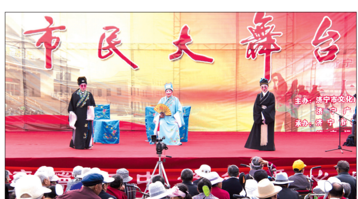
济宁市中集琴亭心歌剧院在中区快活林绿地为市民演出。

此外,众多社会力量也积极参与到“唱戏”行列。围绕开展庆祝中国共产党成立90周年、迎接党的十八胜利召开等重大主题宣传活动,各级检察、教育、老龄、工会、共青团、妇联等部门组织了大量的文艺演出活动,其中近2/3的节目属于戏曲类,进一步优化培育了山东地方戏振兴发展的社会环境和群众基础。