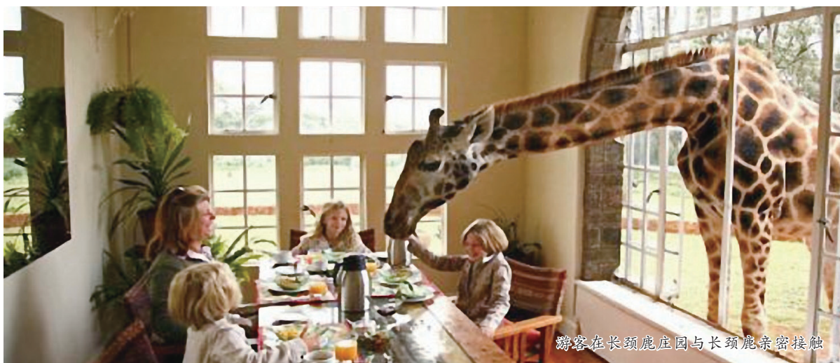
游客在长颈鹿庄园与长颈鹿亲密接触

如今,“创意经济”可谓无处不在,连酒店、旅馆也不例外,很多酒店已经不能满足于仅提供舒适的住宿环境,更在创意上大做文章。海外很多国家涌现出各式各样的创意酒店,有的主打人与自然和谐相处的生态牌,有的则另辟蹊径,主打“离婚经济”牌,让即将离婚的夫妇好聚好散。