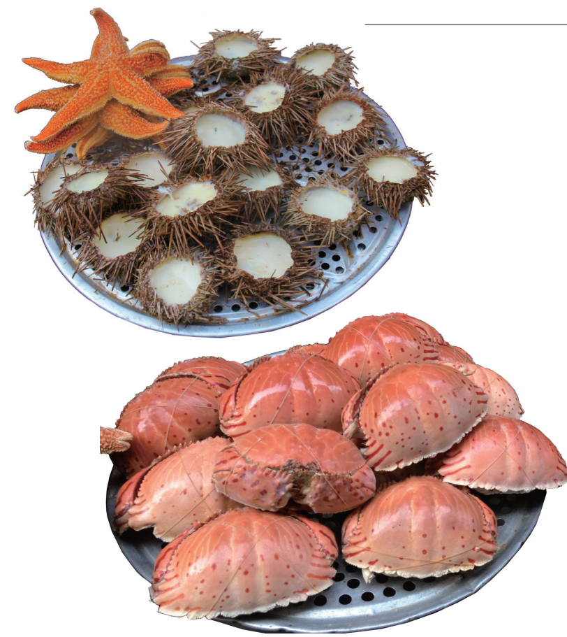
“老街里”的小吃荟萃。