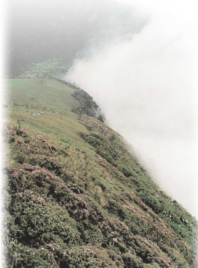
黑竹沟,雾气形成“阴阳界”。

在内的黑竹沟腹地目前尚未开发,几乎都还是原始生态。景区目前仅在入口附近,开发了沟口景区、石门关景区、荣宏得景区、特克马鞍山景区、杜鹃池等景区景点。虽已经划分了景区区块,但尚未开发的不在少