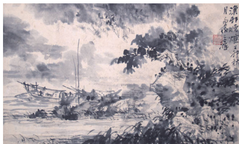
渔村晚烟 60×42厘米 1988年