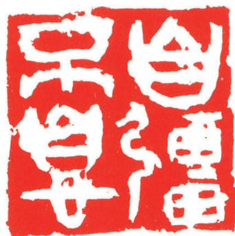
自强不息 3.6×3.6厘米 1988年