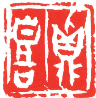
真喜 1.8×1.8厘米 1985年