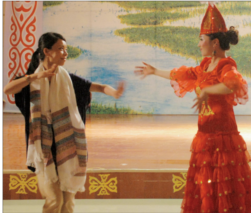
嘉宾与哈萨克族演员共舞

短短几天时间里,内地与港澳嘉宾之间、香港与澳门之间,以及各代表团之间,或故友重逢,或一见如故,或默契渐生,彼此结下了深厚的友谊;为今后进一步的合作交流打下了坚实基础。香港嘉宾团团长、香港艺发局主席王英伟表示,广泛的交流能为双方艺术家带来更多创意,推动三地文化共同发展。参与活动的港澳人士珍惜此次旅程,希望合作推广甘肃文化,推动更多文化交流,让彼此走得更近。