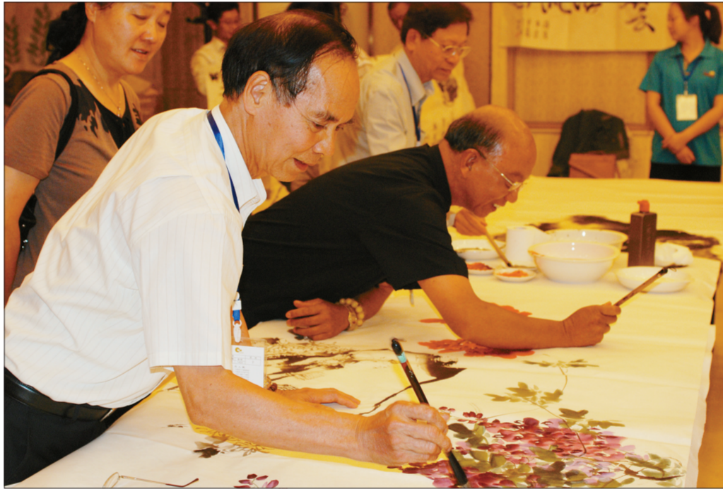
港澳书画家挥毫泼墨