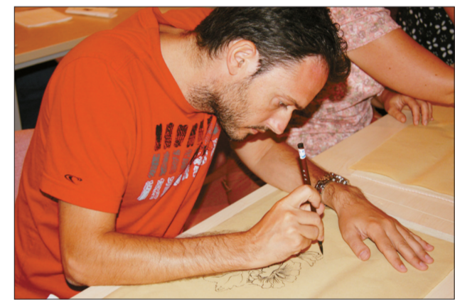
马耳他学员学习中国画

本报讯 7月23日,由马耳他中国文化中心、湖北省文化厅合办的中国画培训班在中心多功能厅开班。