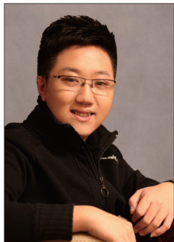
穆雨:宗马派。毕业于北京戏曲艺术职业学院,流派班学员。师承张学津、王琴生、白元鸣等。擅演《赵氏孤儿》、《四进士》、《游龙戏凤》等。曾获2012年全国青年京剧演员电视大赛金奖等。