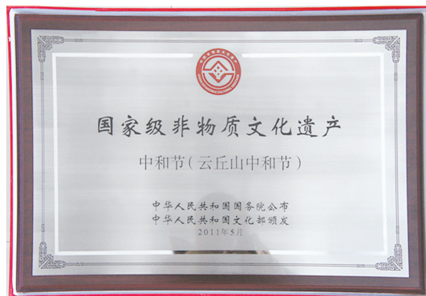
国家级非物质文化遗产——中和节