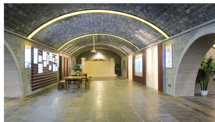
戎子酒文化展览区