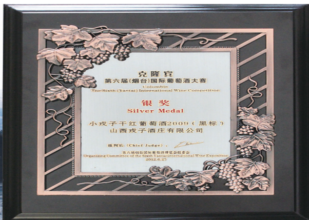
戎子干红获国际葡萄酒大赛银奖