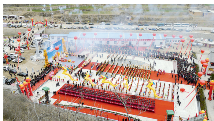
云丘山中和文化节活动