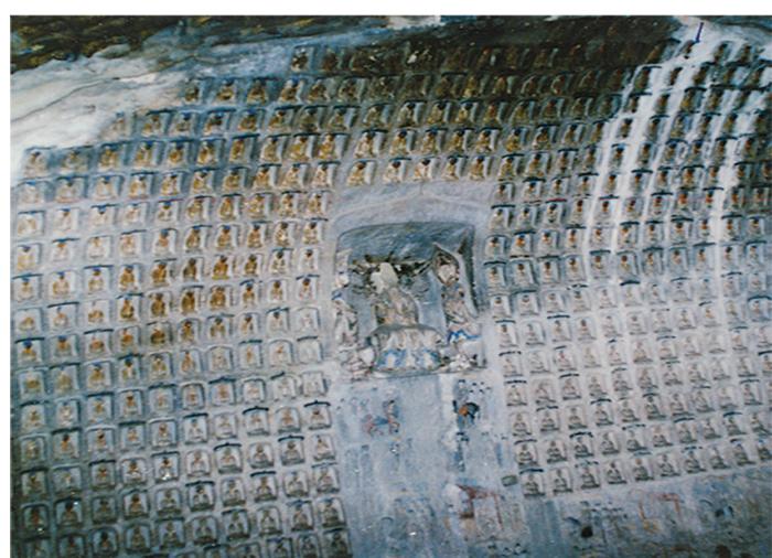
省级重点文物保护单位——千佛洞

乡宁,位于黄河中游,山西省西南,临汾市西隅,吕梁山南端,春秋晋鄂侯居此,称鄂。今址县城始建于宋皇祐三年(1051年),曾铸有镇水铁牛,故有卧牛城之称。