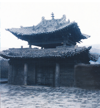
全国重点文物保护单位——寿圣寺