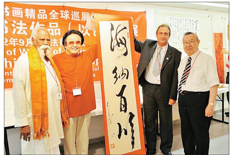
第29届世界诗人大会主席、匈牙利诗人收藏于连胜书法作品