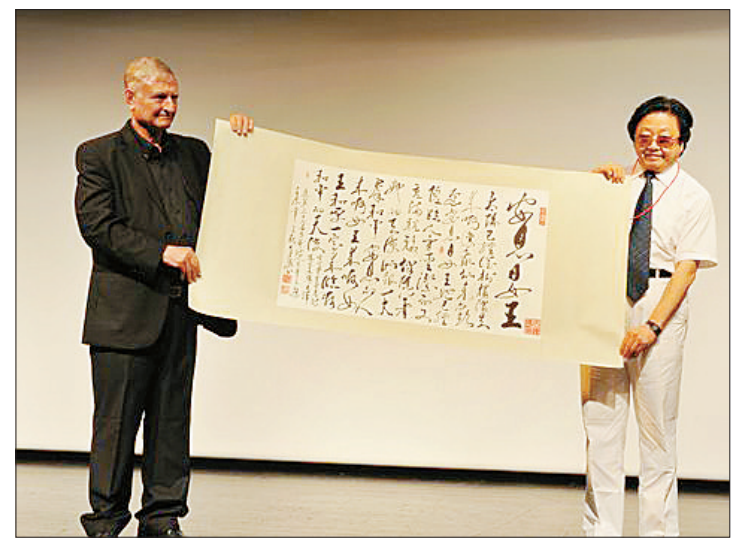
在开幕式上举行的于连胜书法作品收藏交接仪式,这幅书法作品刊发在《2012世界诗选》上,将转赠给以色列前总统那翁收藏。