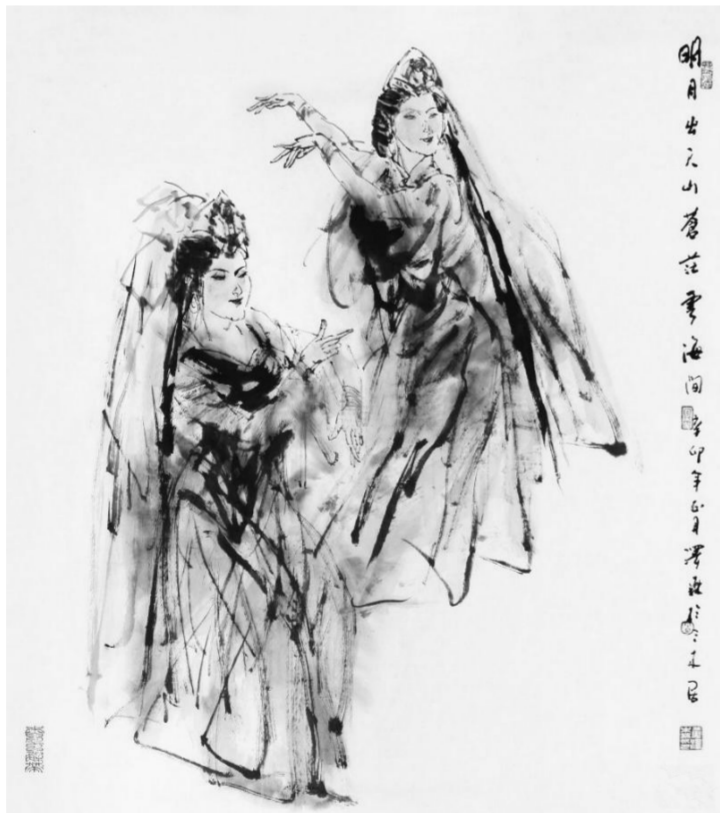
明月出天山(国画) 黄泽森

黄泽森在广东人民艺术学院和广州美术学院学习过,学的是经过消化了的西式教育,他的老师杨之光也是徐悲鸿的学生,徐悲鸿留欧8年,回国后,把欧式的美术教育带到中国,又经杨之光带到广州美术学院,黄泽森曾得其亲炙。而且黄泽森也认真研究过西方的绘画和西方的其他文化。