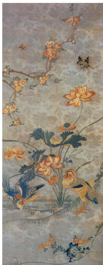
明代鲁绣《荷花鸳鸯图》

6厂，1905年改名工艺传习所。其中绣花工厂的绣品独具特色，并在当时的东洋赛会上获优等奖章。