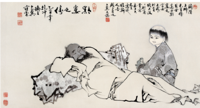
发丝绣作品《黔婁之傳》，获中国工艺美术品百花奖优秀创作设计一等奖