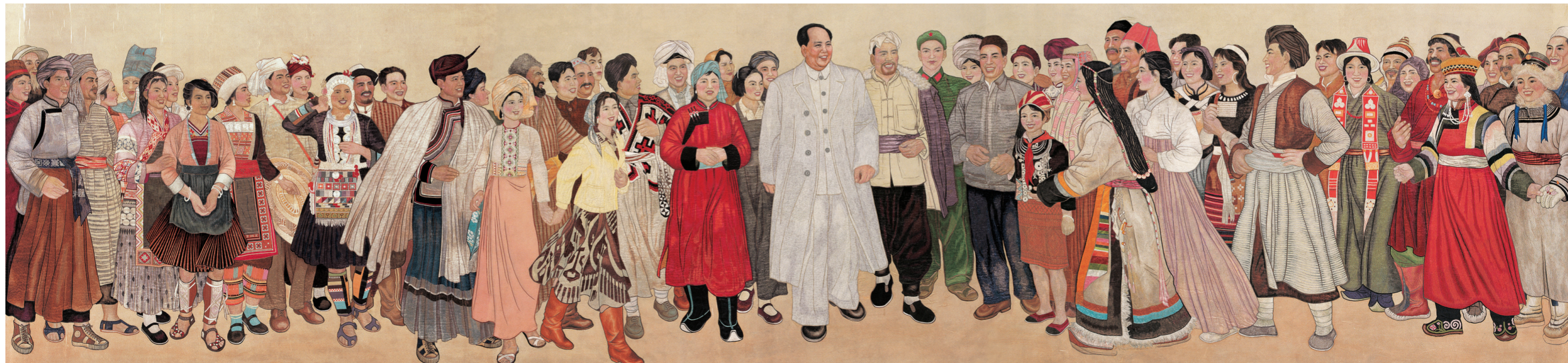
发丝绣作品《六亿神州尽舜尧》