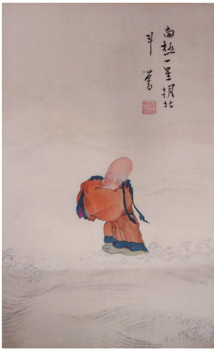
南极仙翁图(国画) 溥儒

达·芬奇、拉斐尔、米开朗基罗等大师的杰作,不少作品是第一次离开意大利本土;而“名家珍品集萃——孙照子女捐赠中国古代绘画珍品展”则囊括了元、明、清三代在中国绘画史上具有重要地位的画家珍品。其中,元黄公望的《溪山雨意图》卷为黄公望70岁左右之作,早于《富春山居图》卷10余年,是目前所见黄公望最早的作品。元倪瓒的《水竹居图》轴为目前所见倪瓒年款的最早作品,也是国内仅见倪瓒设色之画品。明沈周的《桃花书屋图》轴第一次与公众见面,是研究沈周的重要文物资料。明文徵明的《真赏斋图》卷为文氏晚年细笔代表之作。此外,明代赵左、董其昌、项圣谟,清代“四王”、恽寿平、郎世宁、查士标等名家的画品亦为首次公开展览,具有很高的艺术和史料价值。在此,观众既可以欣赏外国顶级艺术大师的油画作品,又可以品读中国书画大家的水墨韵味,世界艺术之美尽收眼底。