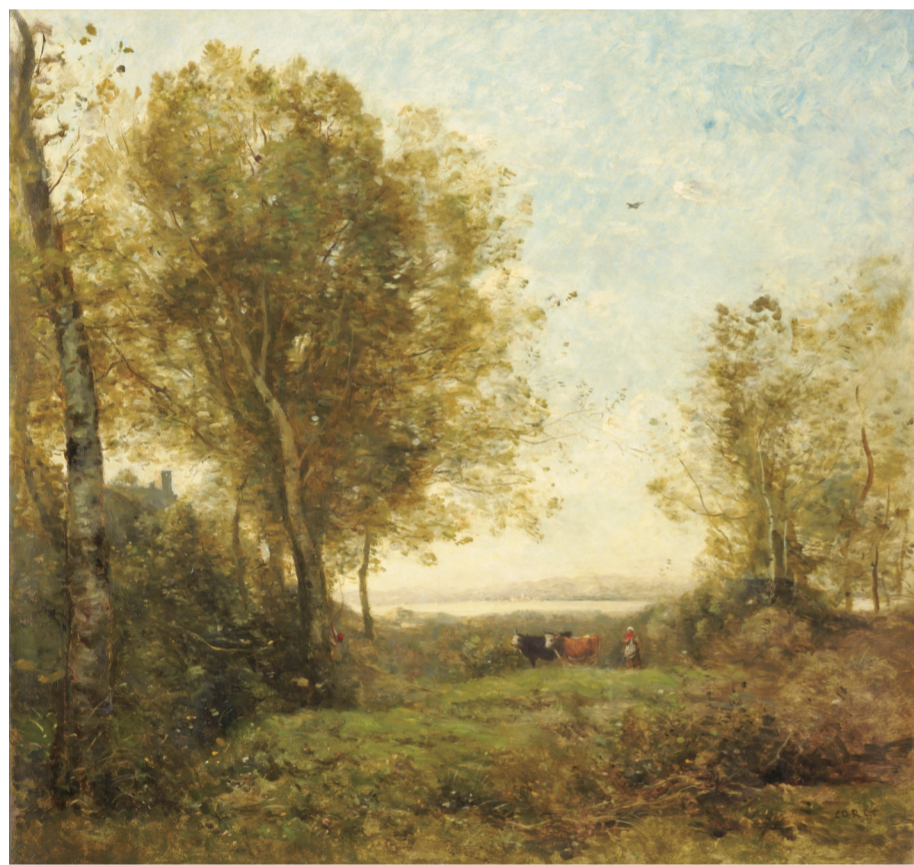
清晨的看牛人(油画) 卡米耶·柯罗