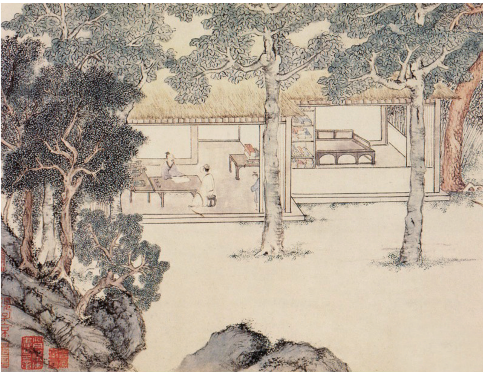
真赏斋图卷(国画) 文徵明

该展精彩演绎了香奈儿品牌与艺术之间的深厚渊源,一幅毕加索于1924年为芭蕾舞剧《蓝色列车》所创作的巨型布景中展览的5个主题:“呼吸”“行动”“爱”“梦想”和“创造”。该剧由达律斯·米尧创作音乐、尚·考克多撰写剧本、亨利·劳伦斯设计舞台装置、毕加索负责节目单及布景创作、香奈儿则担任全剧的服装设计。参观此次展览的观众,还将欣赏到毕加索从未公开过的30余幅画作和由莫迪里阿尼为《蓝色列车》相关主要人物绘制的大幅肖像素描作品。