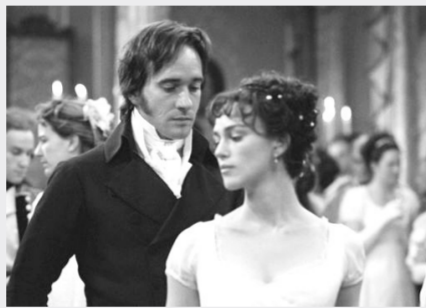
2005年电影版《傲慢与偏见》

2013年，英国各地将陆续开展相关活动，庆祝这部伟大作品的200岁生日。剑桥大学露西·卡文迪许学院将于6月召开会议，探讨这部小说描述的历史环境，并对小说衍生的电影和其他文学作品等进行分析。赫特福德大学计划于7月举办跨学科会议“奥斯汀身在何处”，研究奥斯汀的小说与英国地貌风景之间的联系。