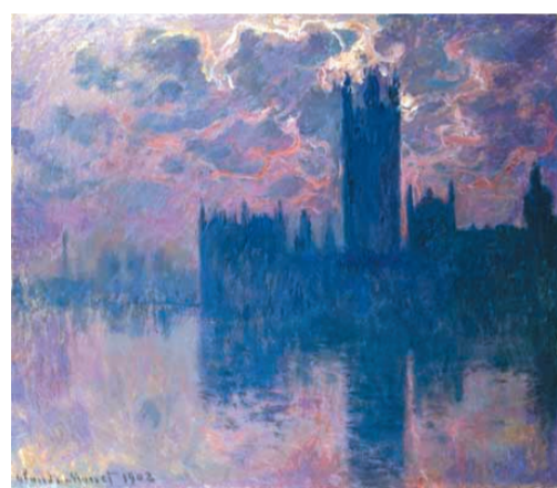
描绘雾中英国议会大厦的莫奈画作

直到1952年末,英国伦敦发生了震惊全球的“烟雾事件”,人们才恍如梦中惊醒。这一年的12月5日,持续数日的无风天气使得位于泰晤士河谷的伦敦被浓雾包围,习惯了浓雾天气的伦敦市民并没有意识到一场灾难即将降临,黄褐色的烟雾导致伦敦街道交通事故频发,不久,除地铁之外的所有交通工具出现瘫痪,人们在浓雾中难辨方向。在有些街区,人们甚至无法看到自己的双脚。持续的雾霾天气使得伦敦咳嗽声四起,各大医院人满为患,排队的人群看不到尽头,迷失在街道的救护车需要用火把引路才能勉强前行。据世界卫生组织相关资料记载,雾霾使得英国的演艺活动受到很大损害。由于浓雾涌进室内,致使观众席上的观众无法看清舞台上的表演,世界著名剧院伦敦沙德勒之井剧院曾不得不临时中断了演出。