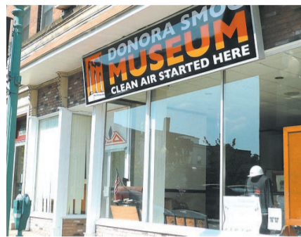
多诺拉雾霾博物馆

1984年10月,美国宾夕法尼亚州小镇多诺拉发生一起恶性烟雾事件。小镇地理位置特殊——坐落在一个马蹄形河谷内,两边高约120米的山丘把小镇夹在山谷中,又是硫酸厂、钢铁厂、炼锌厂的集中地,由于小镇工厂排放的含有二氧化硫等有毒有害物质的气体及金属微粒在气候反常的情况下在山谷中积存不