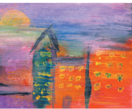
雾霾是美国艺术家作品的重要主题之一

象,同雾都伦敦不同,洛杉矶的雾霾仅出现在干燥晴朗天气的中午和傍晚,从远处望去,人们发现一片淡蓝色的烟雾笼罩在城市上空,也曾成为有些人眼中的特殊风景。浑浊的空气让人出现眼睛干涩发红、咽喉肿痛、胸闷头晕等症状。雾霾也逐渐影响了洛杉矶的城市旅游形象。1943年后,雾霾现象更加严重,导致距离洛杉矶