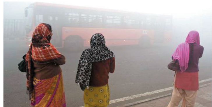
新德里的雾霾天气直到今年1月仍在继续

呼吸困难、眼睛刺痛——2012年11月,印度首都新德里的民众被浓雾折磨。透过灰黄色的空气,太阳光微弱地照射着大地。提早到来的寒冬导致气温骤降,高温度和无风的天气让新德里的空气犹如用粉尘和化学气体调制成的鸡尾酒一般。