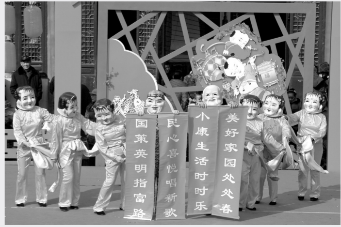
合肥市第十九届新春文化庙会现场。

在合肥举行的第十九届新春文化庙会，市民尽享猜灯谜、看皮影、听大戏的乐趣。阜阳县上举办了民俗踩街表演，民间艺术悉数登场。此外，滁州、亳州等地也举行了民俗闹春活动。（李玮）