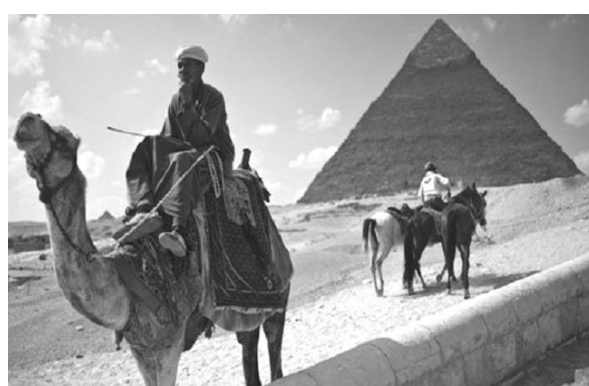
埃及要出租金字塔了? 数日前在卢克索市上空发生的热气球惨剧令世界游客惊悚未定,一则来自阿拉伯媒体的报道又一次将人们目光引向埃及。报道称,为解决债务问题,埃及财政部提出了一项计划——出租包括吉萨金字塔、狮身人面像、拉美西斯二世神庙和卢克索神庙在内的多处世界级古迹,最短租期为5年。据估计,出租这些“国宝”将换来近2000亿美元收入,足以帮助埃及偿还所有债务。