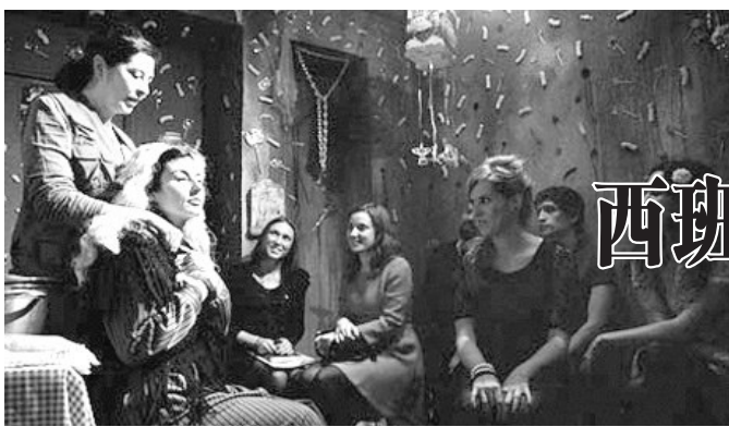
马德里微型剧场的演出中,演员和观众距离很近。

年,但因为不雅的定义并不明确,所以很难执行。冰岛政府强调,这项计划不是将所有有关裸体和性的内容都删除,不雅将被定义为涉及暴力、侮辱性的内容。专家组正在研究具体操作问题,一种方式是使用冰岛信用卡购买色情物品将构成犯罪,另一种方式是设置一个全国互联网色情信息过滤器,或直接屏蔽色情网站。(郑再 编译)