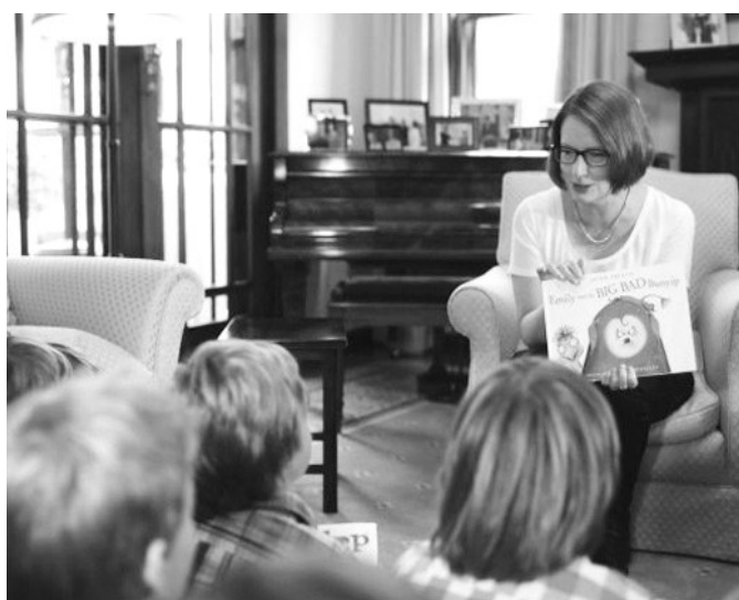
澳大利亚总理吉拉德为儿童朗读《艾米丽和大骗子》。她表示,迫切希望提高儿童的阅读能力。

中三年级时也会面临同样状况。“这意味着,这个人成年后,会被许多工作单位拒之门外。”吉拉德担心,弱化的阅读能力会影响澳大利亚在全球的竞争力。据悉,“阅读闪电战”主要针对幼儿园至小学三年级间的儿童,除了在学校建立一整套完善的阅读训练计划,该项目还特别强调家长的作用。有心理学家指出,通常文化程度较高的父母更有能力给孩子提供语言学习机会,而那些在怀孕期间有大量饮酒习惯,以及患有孤独症和阅读困难症的女性会导致新生儿语言能力受损。因此,家长被鼓励在家进行有规律的阅读活动,并参与到课堂教学中去。(李鹤琳 编译)